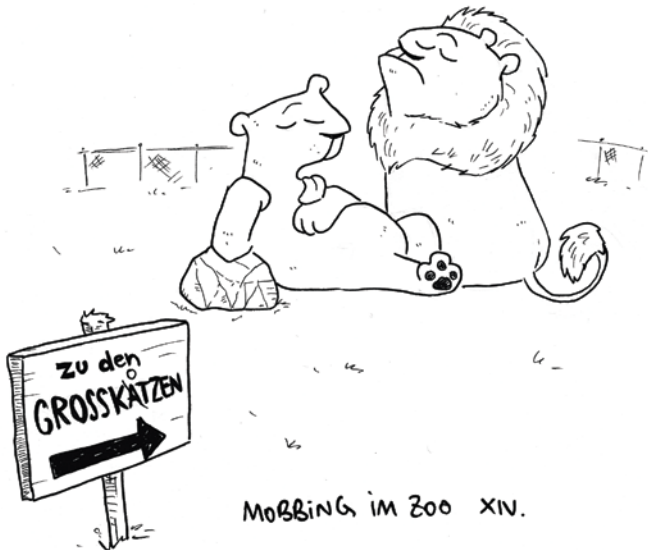
MOBBING IM ZOO XIV.