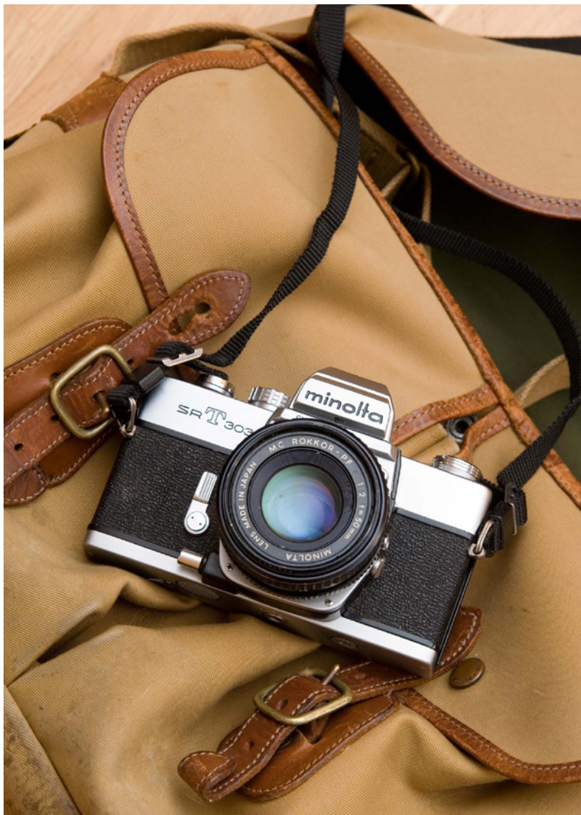
Abbildung 3.5: Eine Minolta SRT 303 mit dem Rokkor 2/50 mm. Die in den 60er und 70er Jahren beliebte SRT-Kamerareihe erfreute den Benutzer durch einfache Handhabung und hohe Zuverlässigkeit. Minolta-Objektive und im Besonderen das hier aufgesetzte 50-mm-Objektiv zeichnen sich durch eine hohe optische Qualität aus. Leider existiert diese einst große Marke wie so viele andere nicht mehr als Kamerahersteller.