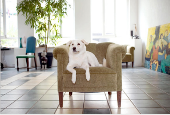
Abbildung 3.2: 35-mm-Weitwinkel- objektiv