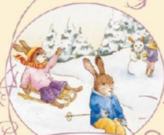
Winter in der Häschen sch ule