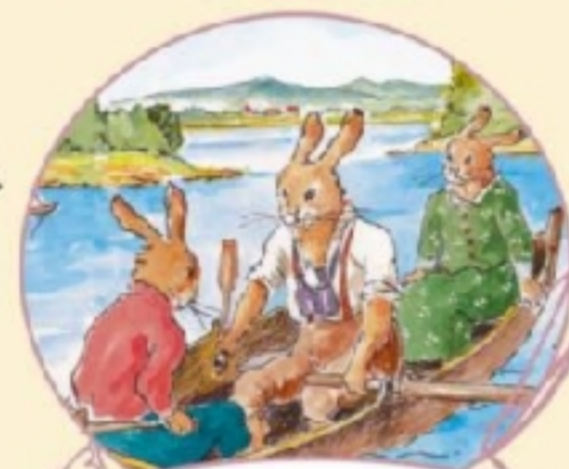
Ferien in der Häschen sch ule