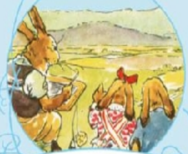
Ein Tag in der Häschenschule