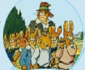
Der Häschen- Schulenausflug