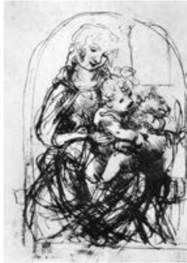
Abb. 2: Leonardo da Vinci, Studie zur Madonna mit Katze, British Museum, London

chen und merken, dass die Welt nicht immer tut, was man von ihr will. Mildem Blickes scheint nun der Junge zu erkennen, dass auch er geduldig sein muss mit der eigenwilligen Katze, so wie die Mutter es mit ihm ist.