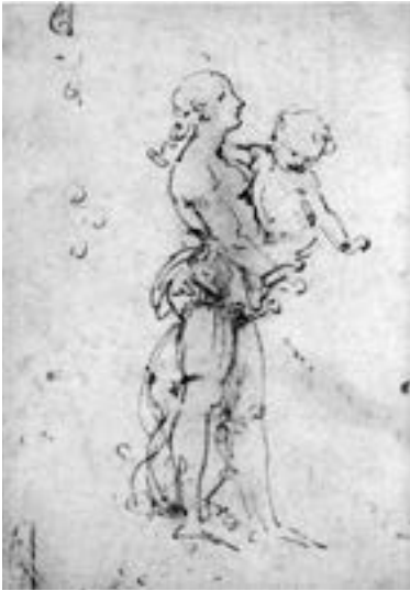
Abb. 1: Leonardo da Vinci, Studie einer jungen Frau mit Kind, British Museum, London

will die Neugier des Kleinen nicht bremsen, aber sie hat ihre eigenen Ziele und arbeitet der Schwerkraft so freundlich wie bestimmt entgegen. 6 Ein Kind will und muss sich bewegen, es mag klein sein, aber es hat seinen eigenen Kopf. (Abb. 1)