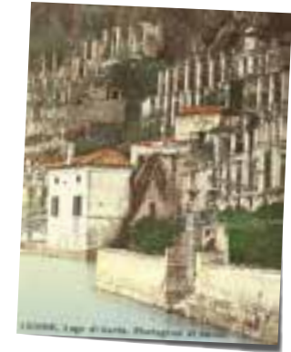
La Limonaia del Castèl in Limone am Gardasee; historische Ansicht

Lawrence schildert im Folgenden genau, wie die Bretter festgenagelt werden und so die Zitronengärten, die Limonaia, sukzessive unter einem Verschlag verschwinden. In kalten Nächten werden zu-