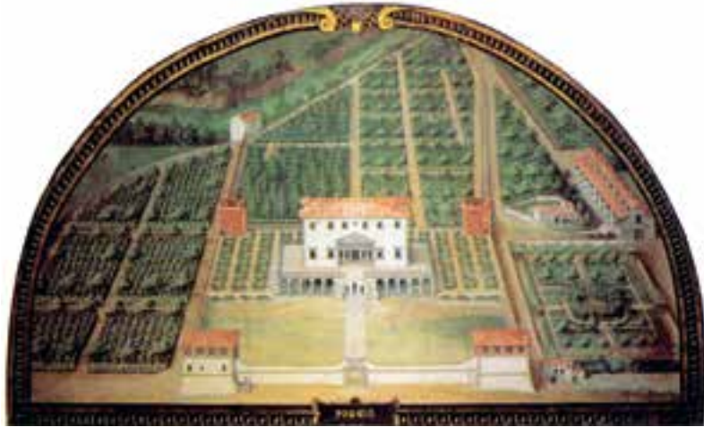
Historische Ansicht der Villa Medici in Castello in den Hügeln von Florenz mit ihren terrassenförmig angelegten Gärten samt Zitrusammlung

Zitrusbäumen zulegten. Großzügige Anlagen finden sich etwa in Bayreuth, in Darmstadt, in Schwetzingen, im Schloss Augustusburg in Brühl und in Wernigerode. Eindrücklich ist die große Limonaia, die 1848 im Park des Schlosses von Racconigi, einem der Landsitze der savoyardischen Dynastie im Piemont, gebaut wurde: ein enormes Glashaus nach englischem Vorbild.