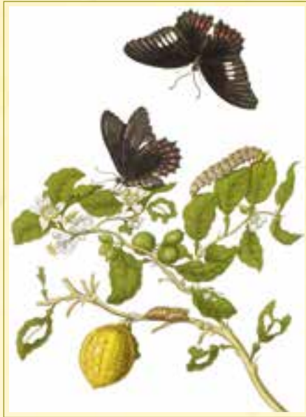
Maria Sibylla Merian, Limonen in Surinam, 1705

lichen Struktur, die den süßsaurigen Saft des Fruchtfleisches im Mund explodieren lässt. Bedurfte es noch vor Kurzem eines hohen Aufwandes, um an solche Pflanzen zu gelangen, bietet sie inzwischen schon die Pflanzenabteilung des Baumarktes an. Noch immer ist man aber gut beraten, sich beim Kauf den Rat der Spezialisten einzuholen.