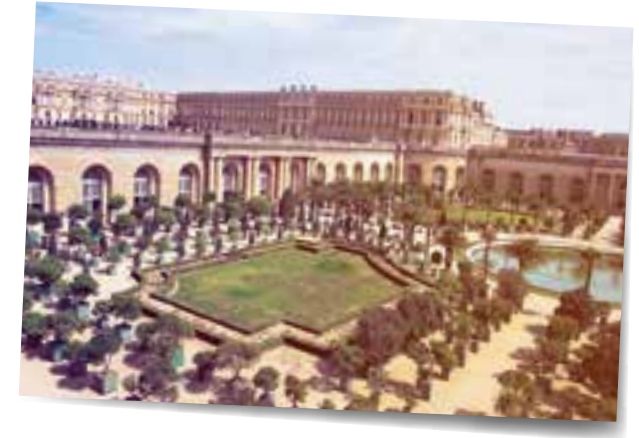
Die Orangerie von Versailles umfasst über 1200 Kübelpflanzen, darunter viele Zitruspflanzen.

mo, gedeihen sie seit Jahrhunderten. In Kalabrien finden sich große Bestände von Bergamotte-Bäumen, und etwas weiter nördlich wachsen die Etrog-Zitronen. In Spanien ist bereits die Region um Valencia ein bestens geeignetes Anbaugebiet insbesondere für Orangen.