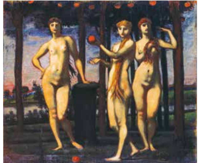
Mitteltafel »Die drei Frauen« des Triptychons »Die Hesperiden« von Hans von Marées, 1884/85, München, Neue Pinakothek

Eine erste Spur leitet uns zur klassischen Antike, zur Geschichte des Helden Herkules, der die Äpfel der Hesperiden raubte, die als Zitrusfrüchte gedeutet wurden. Jeder Besitzer einer Orangerie sah sich umgeben von der Aura und der Kraft des antiken Helden. Von hier führt auch eine direkte Linie zu den diversen Hesperidengärten und zu gleichlautenden Publikationen im Zeitalter der Renaissance. Auch der mythische Hintergrund des trojanischen Kriegs, das Urteil des Paris, ließ sich einbeziehen, indem der Apfel des Paris, der Preis für die Schönste der Göttinnen, als goldener Apfel und somit als Zitrusfrucht