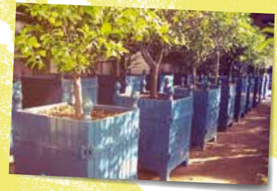
Erfunden für die Haltung von Zitruspflanzen: die Pots de Versailles

Die Globalisierung hat dafür gesorgt, dass auch neue, »modische« Zitrusfrüchte schnell bei uns den Markt erobern. Vor 20 Jahren konnte hierzulande noch niemand Yuzu ( Citrus ichangensis x Citrus reticulata var. austera ), heute hat sie in den Speisekarten vieler Restaurants Einzug gehalten. Und auch die Finger Lime ( Microcitrus australasica ) mit ihren an Kaviar erinnernden kugeligen Saftschläuchen gehört ins Repertoire der Gourmetküchen. Und Sorten, die wir früher nicht kannten oder es nicht gewagt hätten, sie zu erwerben und sich ihrer Pflege anzunehmen, tauchen heute im Supermarkt auf.