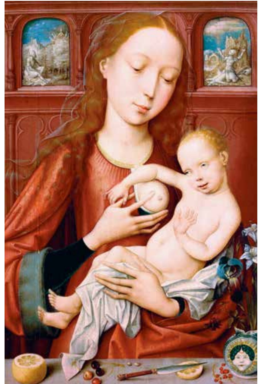
»Maria mit dem Kind«, Werk eines niederländischen Meisters, um 1500, gefirniste Tempera auf Eichenholz, Basel, Kunstmuseum, Sammlung Max Geldner

Cosimo III. de Medici, großer Sammler und Bewunderer der Zitrusfrüchte, ließ zwischen 1699 und 1715 vom florentinischen Maler Bartolomeo Bimbi Gemälde von Zitrusfrüchten anfertigen, die für die