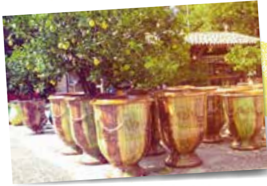
Die Vasen von Anduze eignen sich hervorragend für Zitrusfrüchte und werden noch heute in Familienbetrieben in alter Form hergestellt.

Die Auswahl an brauchbaren Tongefäßen ist insgesamt groß. Man kann Zitruspflanzen durchaus auch in glasierte Gefäße pflanzen, etwa in die prächtigen Vasen von Anduze am Fuße der Cevennen, die auf eine lange und großartige Tradition zurückblicken. Den höchsten Bekanntheitsgrad hingegen haben die Pots de Versailles, die als Gefäß aus einer Kombination von Holz und Metall die Pflanzen rechteckig und zaunähnlich umschließen und einen sicheren Transport der ins Winterquartier ermöglichen. Früher wurden sie mithilfe von hölzernen Tragstangen transportiert, heute erledigen Hubstapler diese Arbeit.