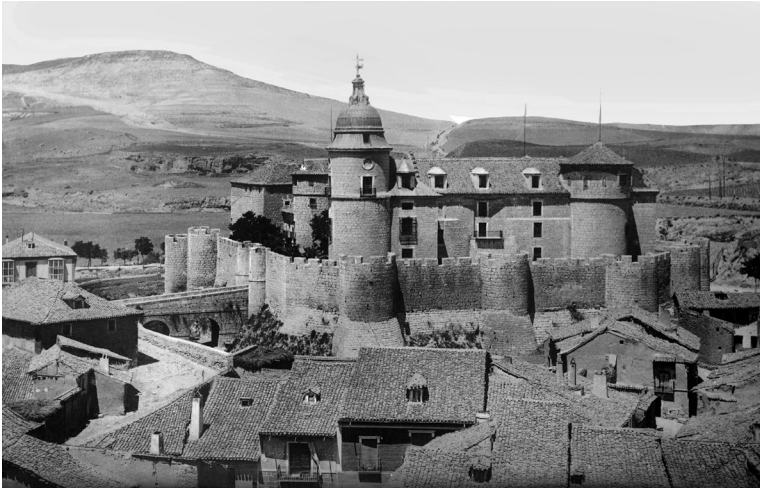
Abb. 2: Das Archivo General de Simancas, um 1860

laut sei, vor allem aber wegen der musikliebenden Wirtin. Abgesehen von Fuhrleuten könne niemand ihr Gitarrenspiel länger als eine Nacht ertragen. So geht er also weiter, mit seinem schweren Gepäck (viele Bücher), bis zum Dorfplatz, der plaza , die von zwölf Häusern umgeben ist, alle versehen mit einem Balkon im ersten und einzigen Stockwerk.