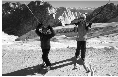
Skihasen auf der Piste

da ganz seiner Meinung und ich glaube, wir haben viel in eine gute, stabile Beziehung zu unseren Töchtern investiert. Aber es wäre zu einfach zu sagen, dass sich das jetzt auszahlt. Wir erleben in unserem Umfeld auch Familien, die durch Krankheiten oder andere Umstände an ihre Grenzen kommen. Und mir ist bewusst, es ist Gnade, dass wir uns als Familie haben, dass wir gesund sind, zusammenhalten und aufeinander zählen können.