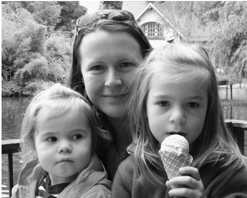
Eis essen im Leipziger Zoo