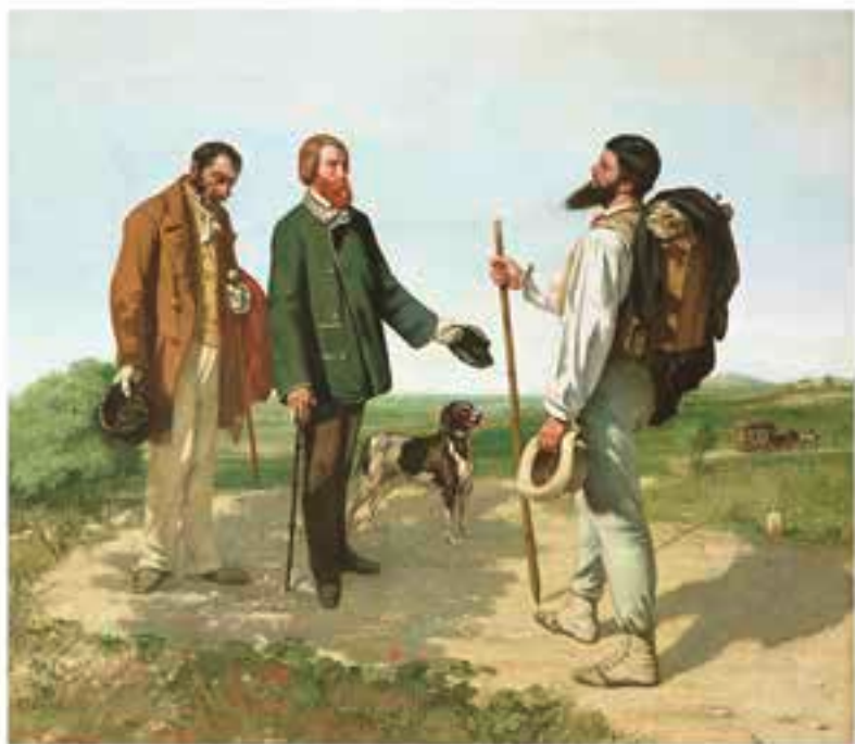
Gustave Courbet, Bonjour, Monsieur Courbet (1854); Montpellier, Musée Fabre