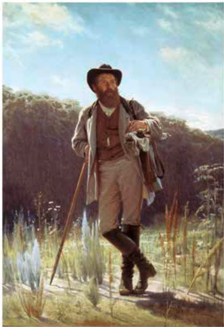
Iwan Kramskoi, Bildnis des Malers Iwan Schischkin (1873); Moskau, Staatliche Tretjakow-Galerie