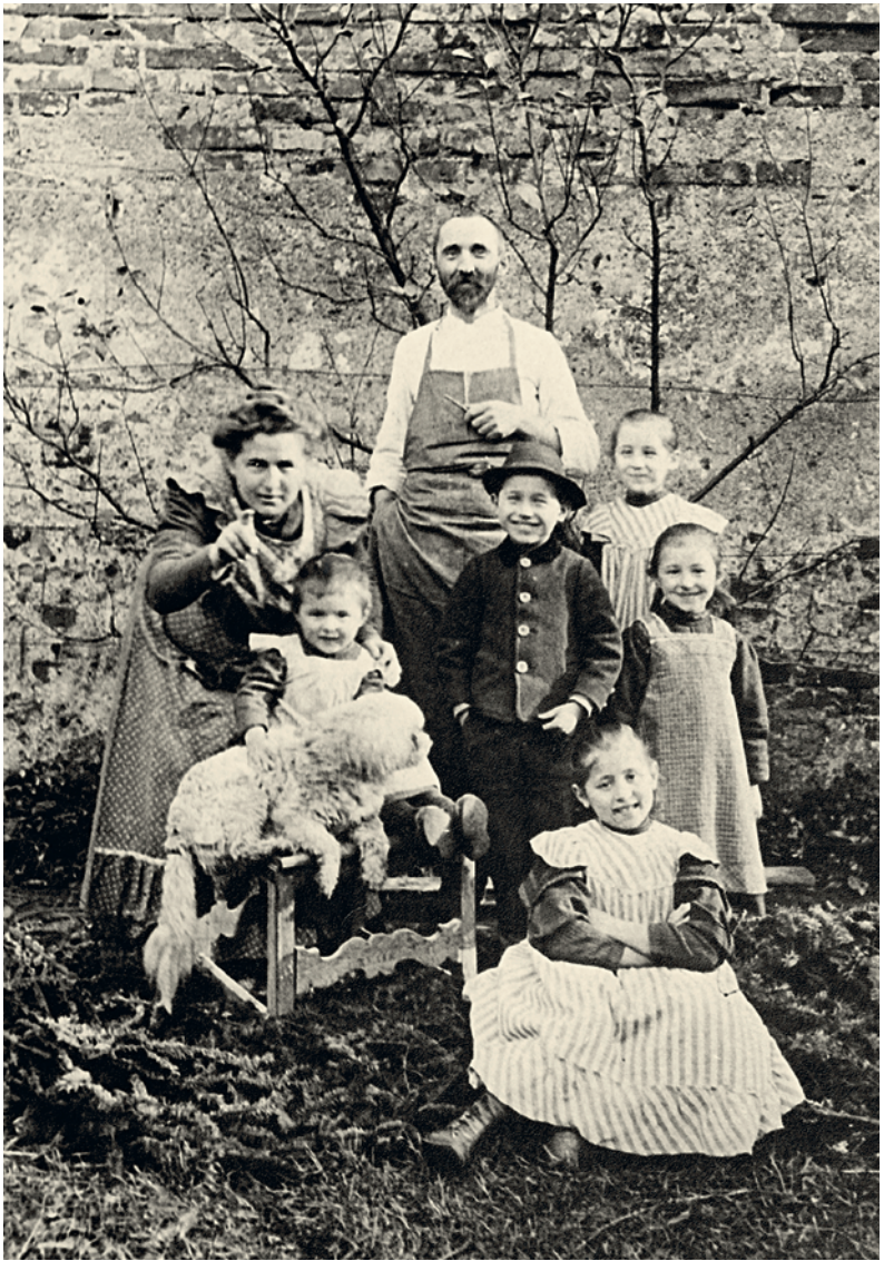
Die Gründerfamilie der Hipp-Baby-Kost, Familie Hipp um 1908