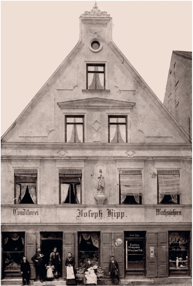
Lebzelterhaus um 1910