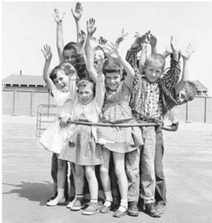
Hula-Hoop-Reifen: Kalifornische Schulkinder demonstrieren 1959 stolz ihren neuen »Weltrekord« in der Disziplin »Wie viele Kinder passen in einen Hula-Hoop-Reifen?«. Üblicherweise besteht die Kunst darin, den Reifen durch die Bewegung der Hüften um die Taille kreisen zu lassen, ohne dass er zu Boden fällt.