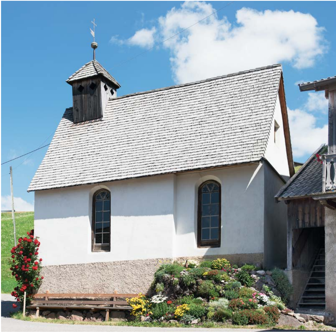
St. Anna, barocke Hofkapelle aus der ersten Hälfte des 18. Jahrhunderts