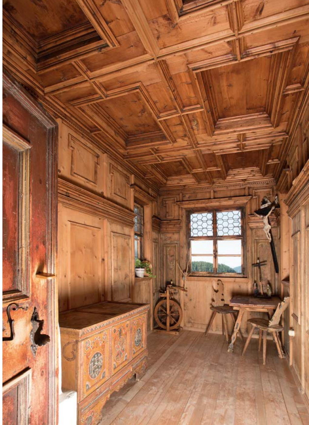
Richterstübele mit Täfelung in späten Renaissanceformen

unterstützt durch Beiträge, vorbildlich erhalten. Die erstmalige Vergabe eines Beitrages der Steinkeller Stiftung zur Erhaltung eines kulturhistorisch wertvollen Bauernhofes erfolgte im Rahmen der 61. Landesversammlung des Südtiroler Bauernbundes am 23. Februar 2008.