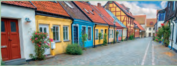
Ganz links: In Österlen haben sich viele schwedische Künstler niedergelassen, um zu malen. Jedes Jahr zu Ostern findet eine große Ausstellung statt. Links: Viele der bunten Fassaden in Ystad sind im Sommer pittoresk bewachsen.