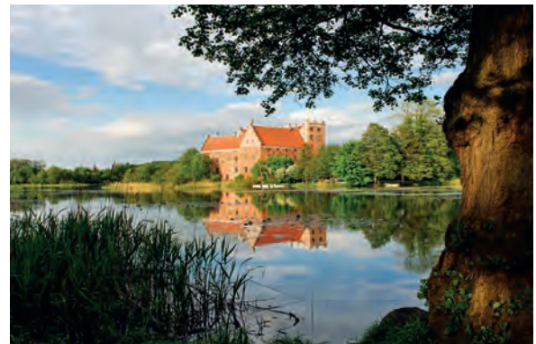
Idyllisch liegt Schloss Svaneholm direkt am See.

der von Henning Mankell geschaffenen Romanfigur des Kommissars Kurt Wallander Weltberühmtheit erlangt. Viele Tausende seiner Fans pilgern alljährlich begeistert zu den Orten, an denen Wallander auf Verbrecherjagd ging, die Touristeninformation bietet mittlerweile sogar geführte »Wallander-Krimi«-Touren an. Denn die in den Büchern genannten Straßen und Restaurants existieren wirklich und können im Rahmen die-