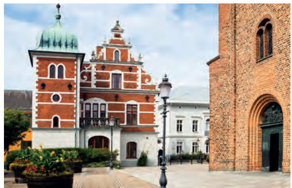
Die Fassade der Marienkirche ziert den Marktplatz von Ystad.

Ein lohnendes Ausflugsziel etwa 40 Kilometer östlich von Malmö ist das Schloss Svaneholm. Auf den ersten Blick wirkt der rote Ziegelbau wie eine Trutzburg. Baubeginn war um 1530, Aus-