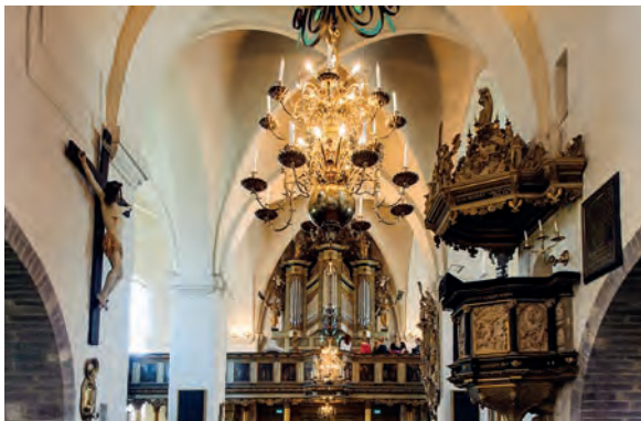
Die Sankt-Maria-Kirche ist das Wahrzeichen von Ystad.