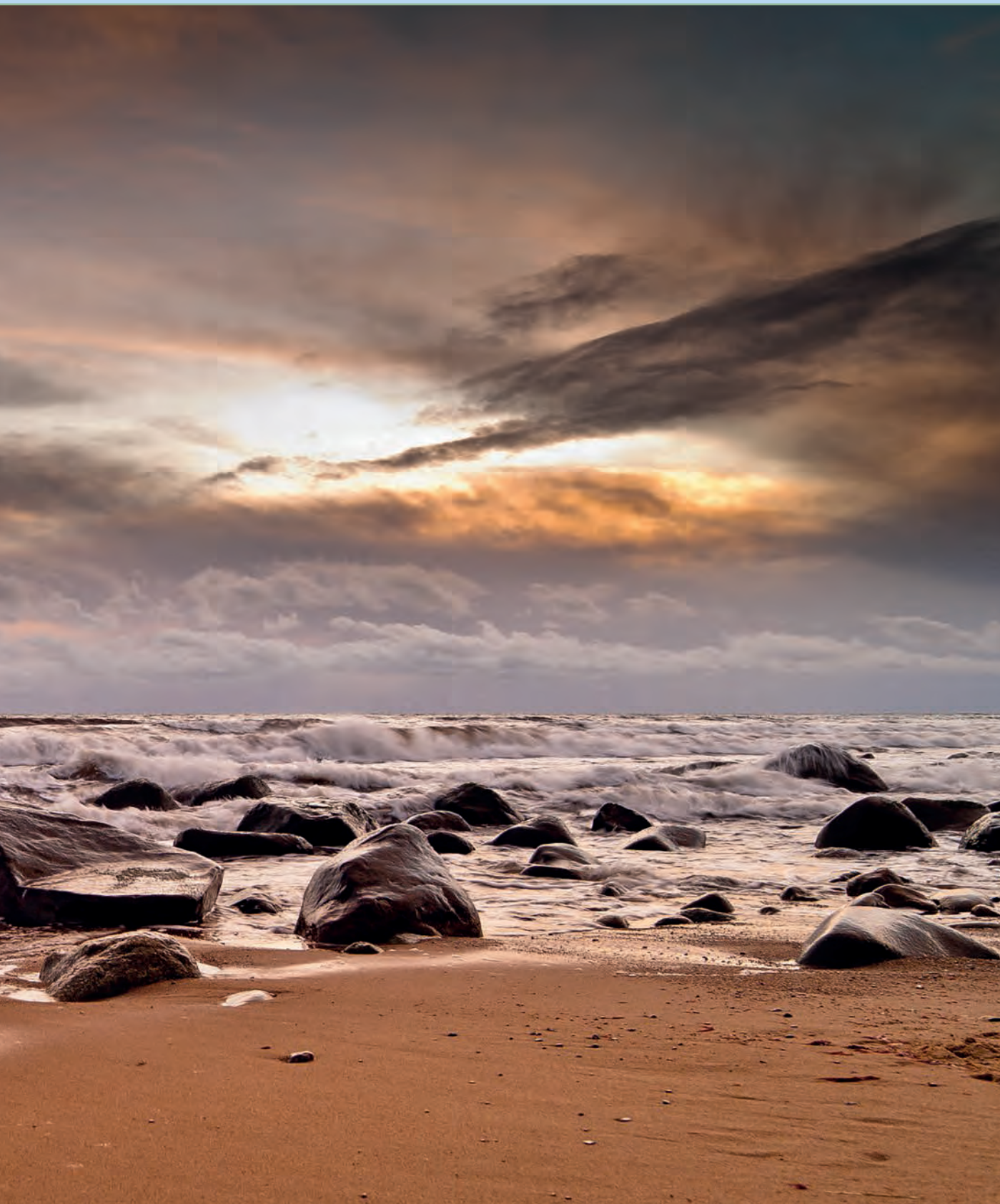
Bild: Mal wild, mal lieblich, die Küstenlinie von Schonen, zeichnet sich durch zahlreiche schöne Sandstrände aus.

Seen, feine Sandstrände; grüne Wiesen und Wälder, pittoreske Dörfer und Schlösser sind nur einige der Postkartenmotive der Region.