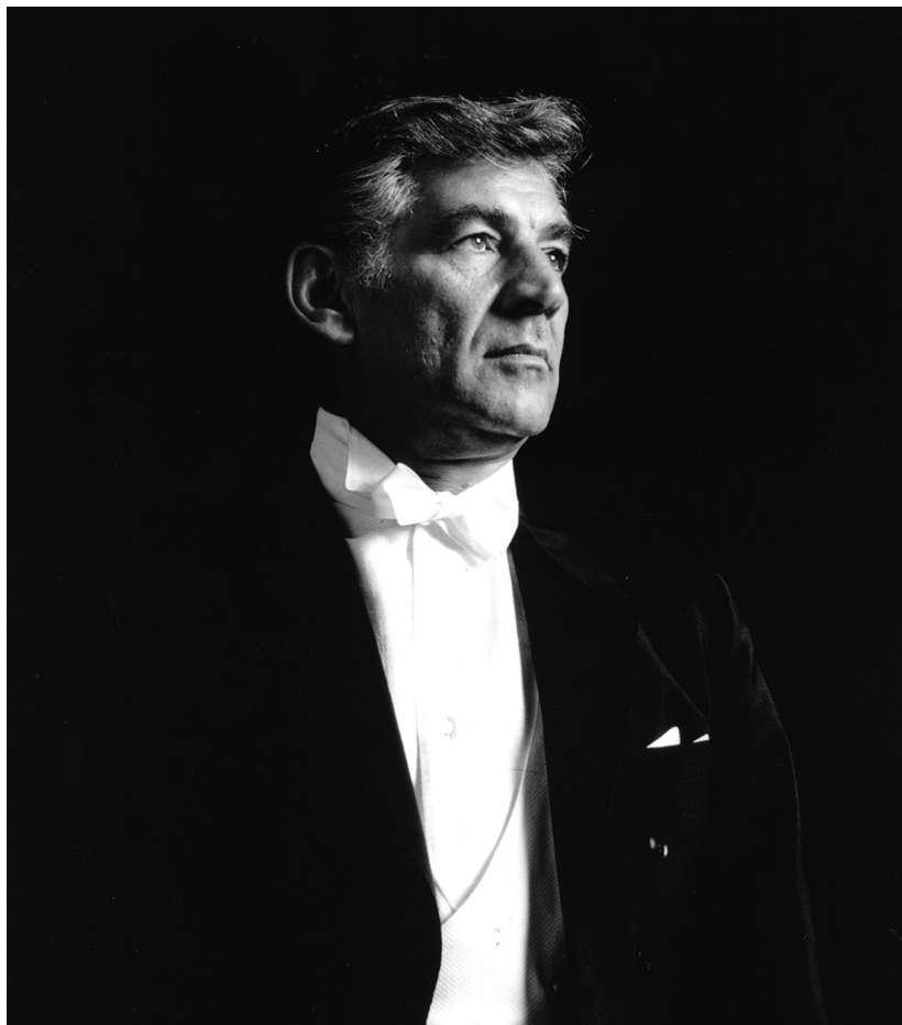
Leonard Bernstein, offizielles Porträtfoto, 1975

technik. Seine Sprünge auf dem Podium, die expressiven Bewegungen und ausdrucksvollen Gesten hielten seine Gegner für alberne Tänze. Eine Reihe von Musikern, Kritikern, Wissenschaftlern, aber auch weite Teile des Publikums fanden diesen körperlichen Einsatz überzogen. Man stellte die Vielfalt der Felder, auf