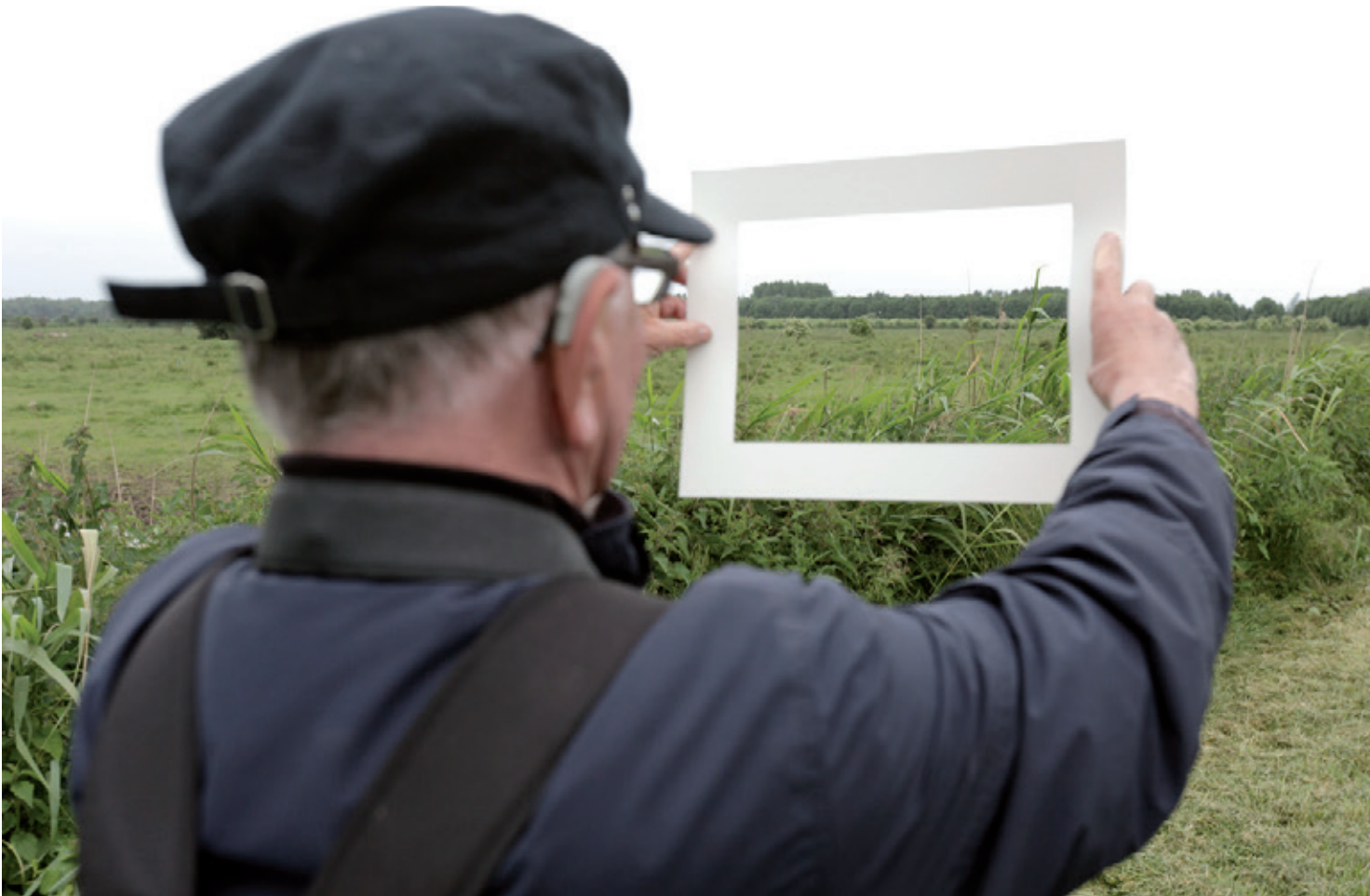
Für Fotografen, die mit der Landschaftsfotografie beginnen, kann ein Rahmen für Erleuchtung sorgen.

lässiger Quelle erwirbt, bezahlt man manchmal weniger als für die neueste »Mittelklassekamera«. Es kann daher die bessere Wahl sein, Ihr erspartes Geld für ein wertbeständiges, qualitativ hochwertiges Objektiv in Kombination mit einem soliden, gebrauchten Gehäuse zu kaufen, statt in ein nagelneues, relativ teures Gehäuse mit einem weniger guten Objektiv zu investieren.