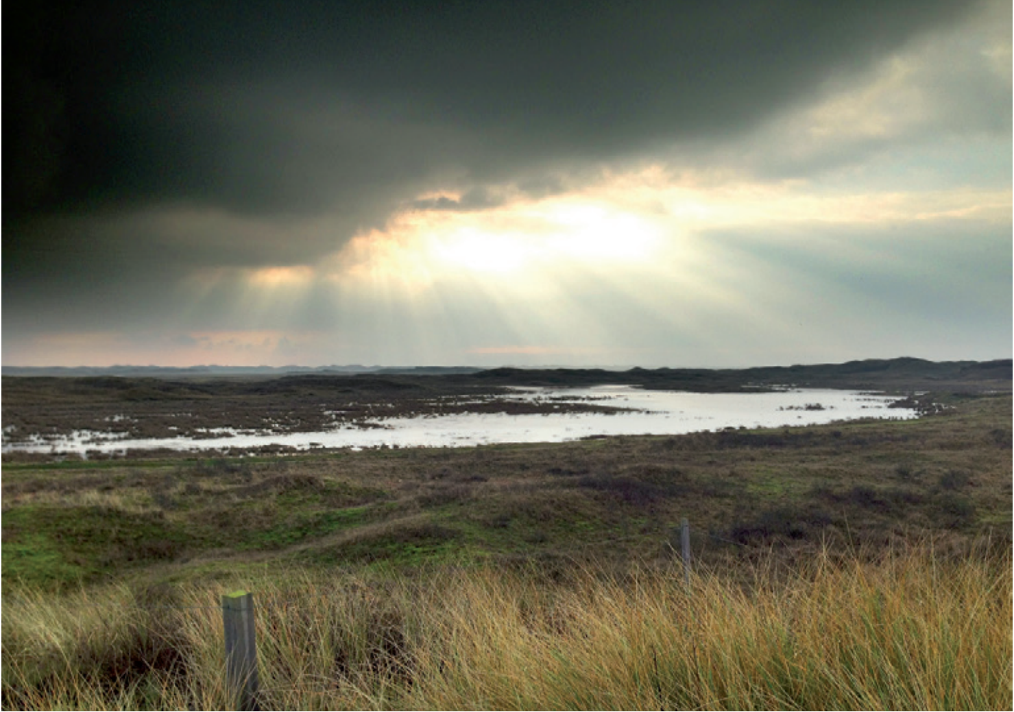
Die Qualität der Handykameras wird immer besser. Es wurden schon Fotobücher herausgegeben, die ausschließlich mit Handykameras aufgenommene Fotos zeigen. Dieses Foto wurde mit einer HDR-App auf einem iPhone 5 aufgenommen | Slufter auf Texel