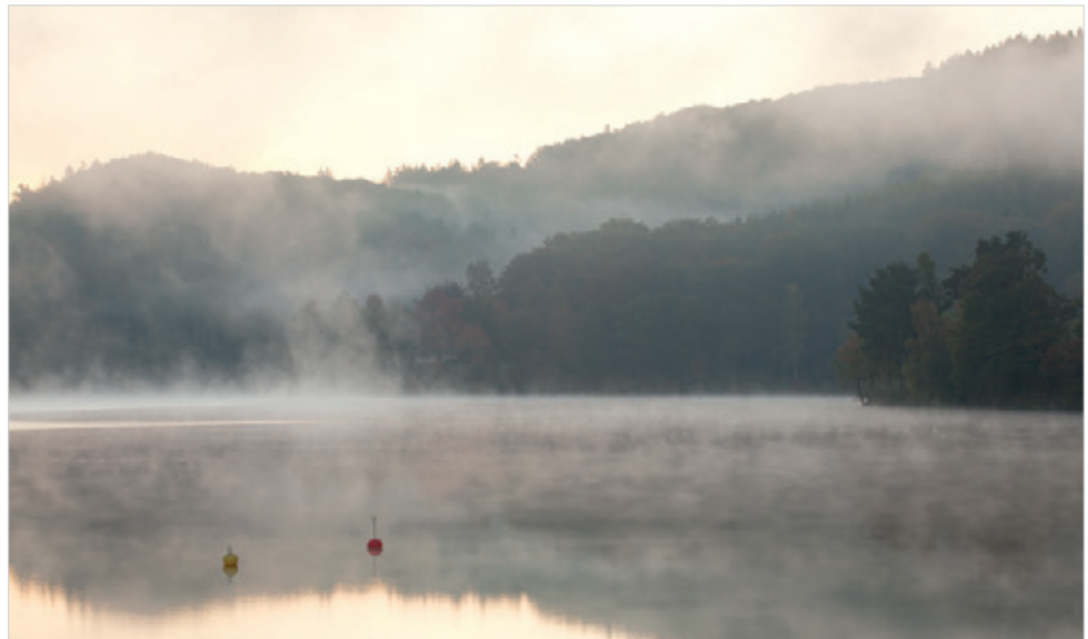
Canon EOS 5D Mark II mit Canon EF 100–400 mm 1:4,5–5,6L IS USM auf 100 mm, 0,5 s, Blende 11, ISO 200

Zwei Aufnahmen von Bart Heirweg mit demselben Teleobjektiv, aber doch völlig unterschiedliche Bilder.