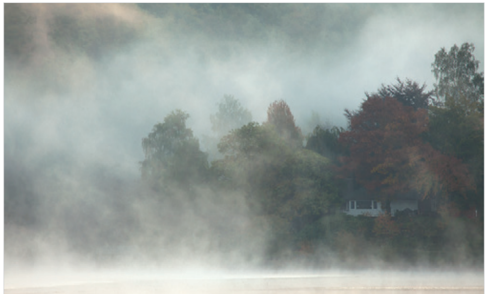
Canon EOS 5D Mark II mit Canon EF 100–400 mm 1:4,5–5,6L IS USM auf 400 mm, 1/60 s, Blende 10, ISO 400

preis für eine bessere Lichtstärke (manchmal doppelt so hoch für eine Lichtstärke von 1:2,8 statt 1:4,0) ist in der Praxis unverhältnismäßig, wenn man das Teleobjektiv nicht auch regelmäßig für andere Motive als