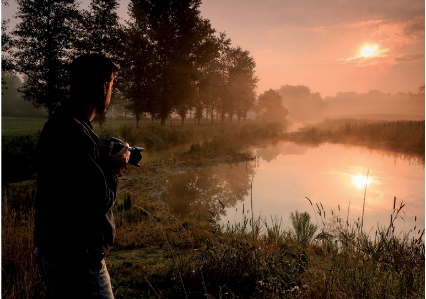
Die Regge bei Diepenheim | Ernst Kremers | Nikon D300 mit AF-S Nikon 12–24 mm 1:4 DX auf 16 mm, 1/90 s, Blende 19, ISO 280