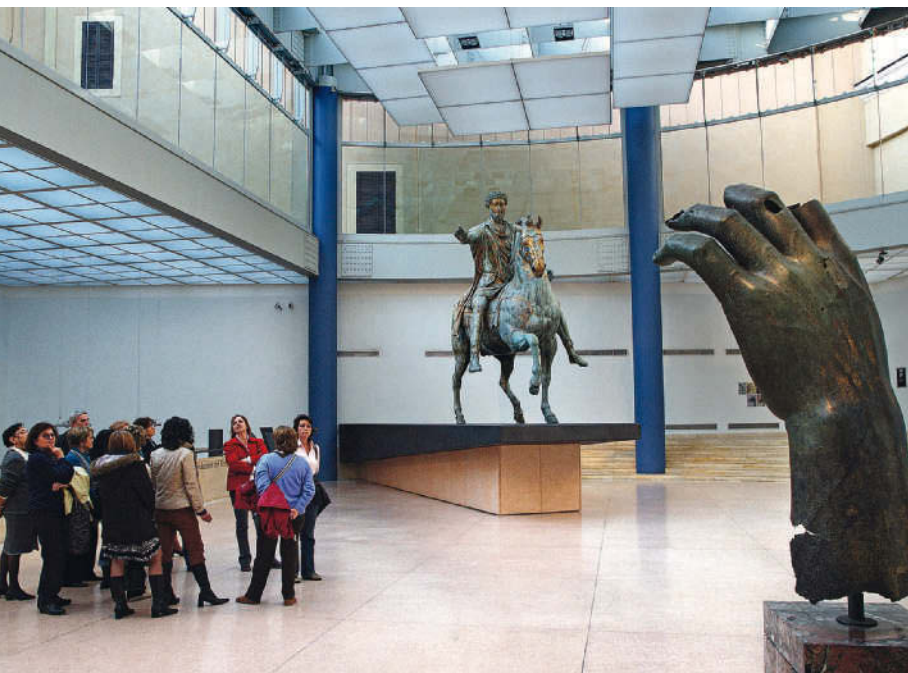
Kaiserliche Handzeichen – die Reiterstatue Marc Aurels und die Bronzehand Konstantins

Im ersten Stock in einem eigenen Seitenraum befinden sich die Kapitolinische Venus , eine römische Kopie in parischem Marmor nach einem griechischen Original, der »Knidischen Aphrodite« des Praxiteles (4. Jh. v. Chr.), sowie 65 eindrucksvolle, realistische Kaiserbüsten. Der berühmten Verwundeten Amazone , einer antiken Replik eines griechischen Meisterwerkes des Polyklet (Mitte 5. Jh. v. Chr.) gilt die Aufmerksamkeit im Mittelsaal. Im Ecksaal gegenüber der Treppe lohnt der Sterbende Gallier (eigentlich: Galater) eine