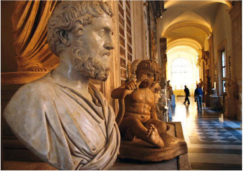
Familiäres Ensemble: Büste eines Römers und spielender Knabe in den Kapitolinischen Museen

nähere Betrachtung. Diese eindrucksvolle Statue ist eine Kopie einer Bronze der Schule von Pergamon und wurde im 16. Jh. in den Ruinen der Horti Sallustiani auf dem Quirinal gefunden.