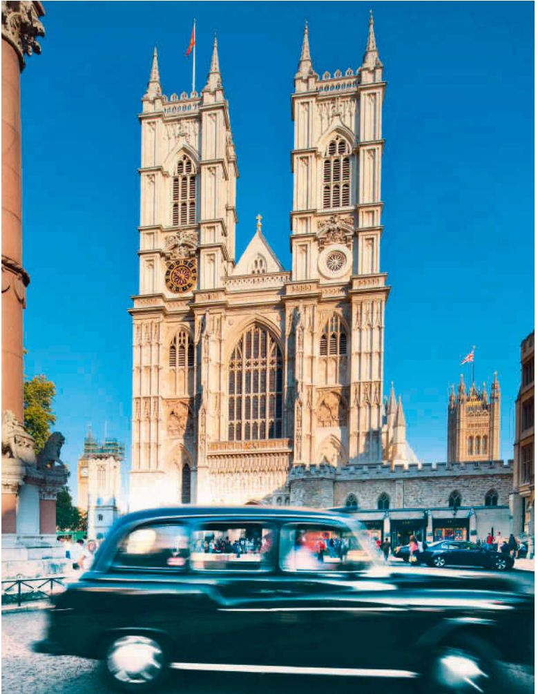
Westminster Abbey ist als Krönungskirche der Royals Inbegriff der britischen Tradition