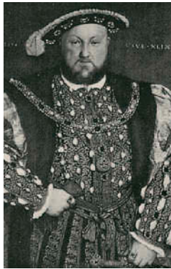
Henry VIII. (1491–1547).

1598 Die erste umfassende Stadtbeschreibung, »Survey of London« von John Stow, erscheint.