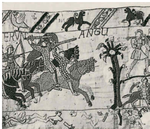
Der Teppich von Bayeux schildert die normannische Eroberung Englands

1455 Beginn der Rosenkriege zwischen dem House of Lancaster und dem House of York. Symbol dieser Thronstreitigkeiten wer-