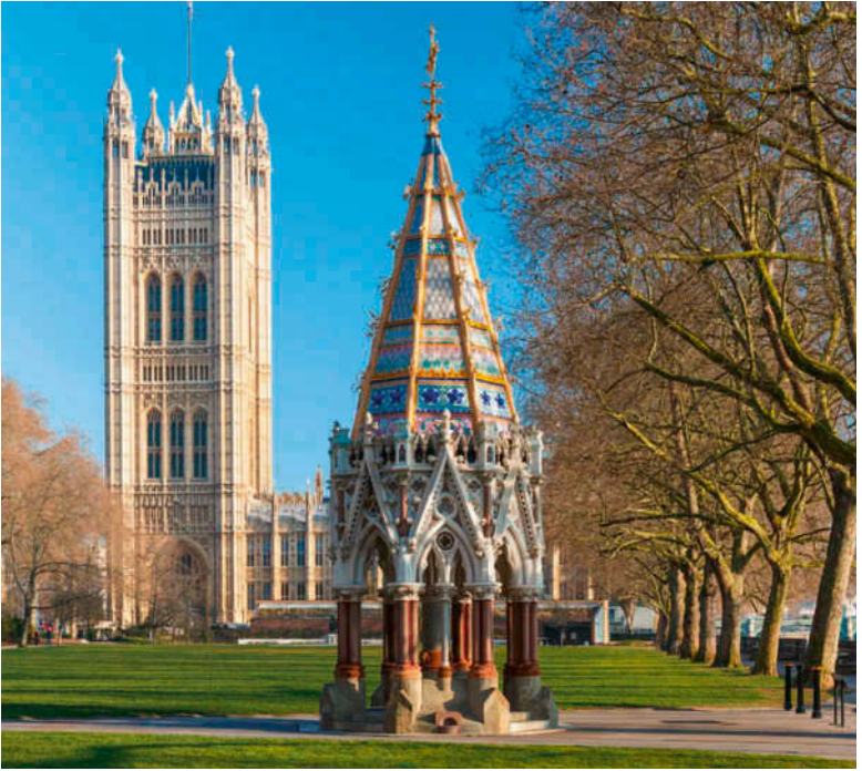
Der Buxton Memorial Trinkbrunnen in den Victoria Tower Gardens vor dem Palace of Westminster

Parlamentsmitglied mit Fragen und Problemen aufsuchen möchten. Auch diesen Raum schmücken zahlreiche Statuen von Politikern des 19. Jh. sowie ein Deckenmosaik , auf dem die Schutzheiligen von England, Schottland, Irland und Wales abgebildet sind.