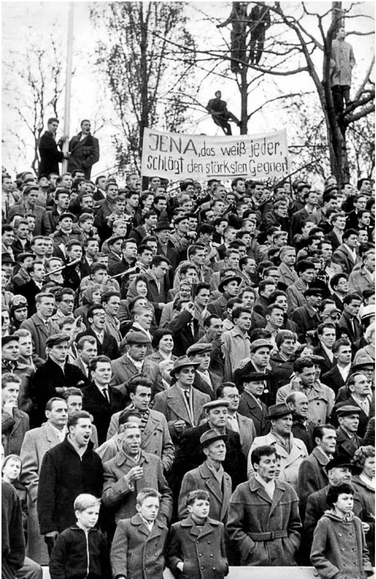
Die Jenaer Fans halten ihrer Mannschaft seit Jahrzehnten die Treue – hier beim Heimspiel gegen Atlético Madrid im Europapokal der Pokalsieger 1962.