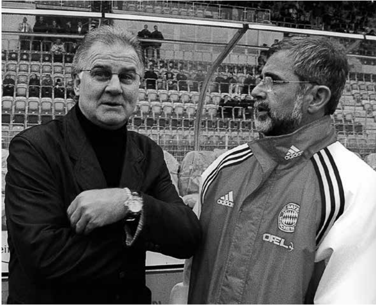
Peter Ducke und Gerd Müller, 2001.

ungeheuer produktiv. Der hat ja Tore mit der Nase und dem Hinterkopf gemacht.«