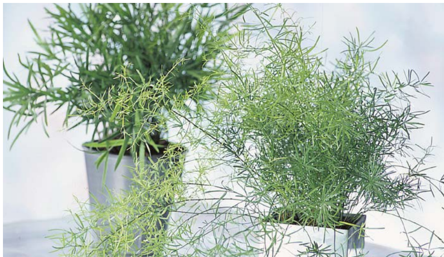
Zierspargel Asparagus -Arten

HERKUNFT: tropische und subtropische Wälder in Afrika und Asien