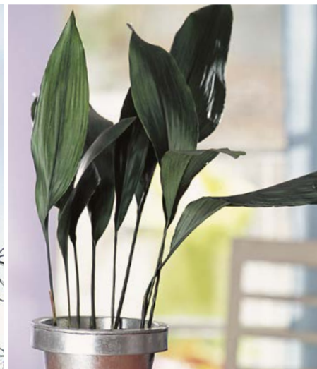
Schusterpalme Aspidistra elatior

Sorten/Verwandte: Sorten von A. densiflorus : 'Sprengeri' mit langen, überhängenden Trieben, 'Myersii' (früher 'Meyeri') besitzt sehr dicht und buschig „beblätterte“ Triebe, die an Katzen- oder Fuchsschwänze erinnern; A. setaceus wird manchmal noch unter dem früheren Namen A. plumosus geführt, die Sorte 'Nanus' wächst gedrungener; A. asparagoides , eine Kletterpflanze mit breiten Scheinblättern, die echten Blättern sehr ähnlich sehen, wird nur noch selten angeboten.