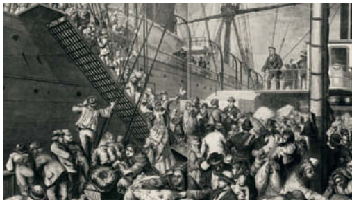
Ab 1850 wird Hamburg für Millionen Auswanderer das »Tor zur Welt« (Bild von 1874)

1923 Wirtschaftskrise, Inflation und hohe Arbeitslosenzahlen treiben weite Teile der Bevölkerung in Armut und Verzweiflung. Ernst Thälmann, der spätere KPD-Vorsitzende