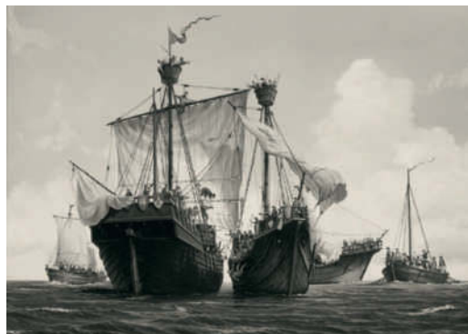
Seeschlacht vor Helgoland, bei der die Hanse 1401 den Pirat Klaus Störtebeker fängt

1335 Ein lange schwelender Konflikt über Steuerfragen zwischen dem Domkapitel und der Bürgerschaft von Hamburg führt zu gewaltsamen Ausschreitungen. Erst als die bislang steuerbefreiten Domherren einen Teil der Grundsteuer zahlen müssen, wird der Friede wieder hergestellt.