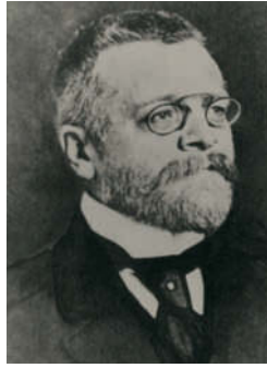
Ab 1909 gestaltet Baudirektor Fritz Schumacher Hamburg

1850 Hamburg wird der nach Bremen wichtigste deutsche Auswandererhafen. In den