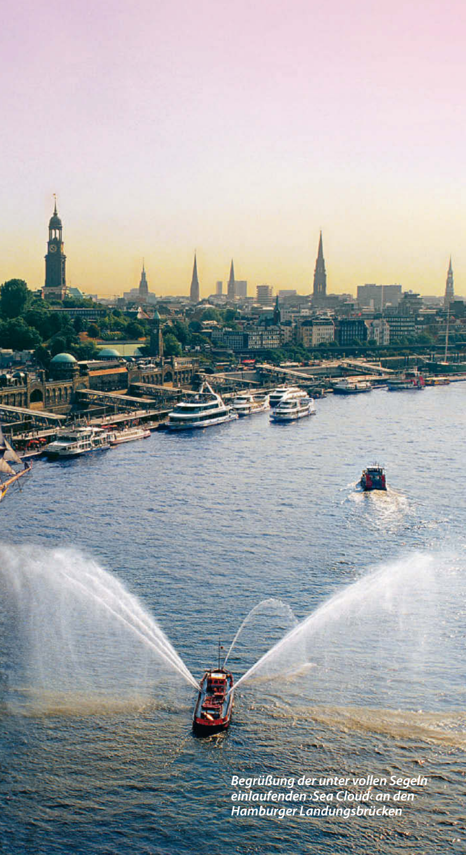
Begrüßung der unter vollen Segeln einlaufenden »Sea Cloud« an den Hamburger Landungsbrücken