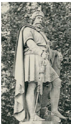
Graf Adolf III. von Schauenburg, Gründer von Hamburg

1037 Neubau der Marienkirche, des späteren Doms, erstmals aus Stein.