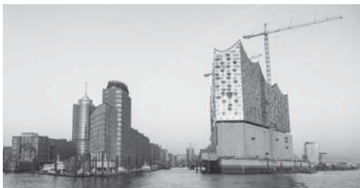
In der HafenCity entsteht Hamburgs neues Konzerthaus: die Elbphilharmonie

2015 Die Hamburger Bürger stimmen in einem Referendum gegen die Bewerbung für die Olympischen Sommerspiele 2024. – Speicherstadt und Kontorhausviertel werden von der Unesco zum Weltkulturerbe ernannt.