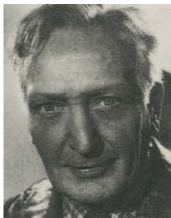
Ein Hamburger Jung – Hans Albers, der »Blonde Hans«

1960 Die Beatles gastieren zum ersten Mal in Hamburg, im Club Indra.