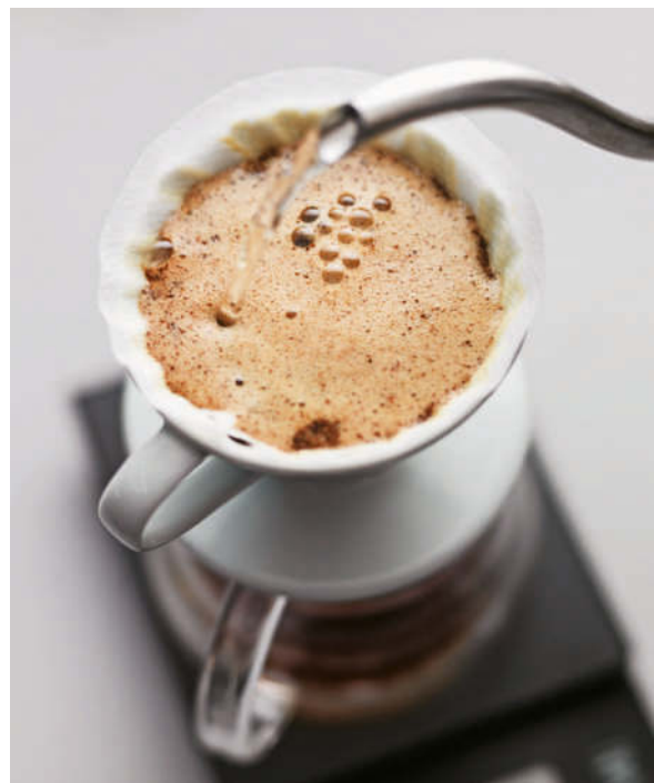
Die Stärke von Pour-Over-Kaffee hängt vom Mahlgrad sowie dem Timing und der Geschwindigkeit des Aufgießens ab.

So verbreitet diese Praxis auch sein mag, wissenschaftlich lässt sie sich nicht groß rechtfertigen. Möglicherweise erleichtert die Freisetzung des Kohlendioxids die Extraktion – einige Untersuchungen deuten zumindest darauf hin. Einen Vorteil aber hat sie mit Sicherheit: Sie bereichert das morgendliche Kaffeeritual um ein angenehmes Element. Denn zuzusehen, wie das Pulver »aufblüht«, hat durchaus seinen Reiz.