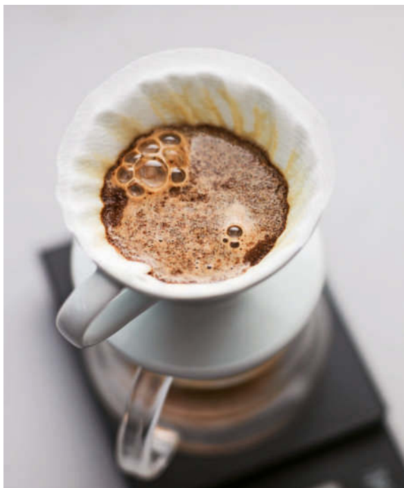
Beim Brühen von Pour-Over-Kaffee ist es üblich, das Kaffeemehl mit Wasser zu tränken, damit es anschwillt.

Um eine gute Aufgussqualität zu erreichen, müssen die drei genannten Variablen so konstant wie möglich bleiben. Wenn beispielsweise jemand die Kaffeemenge versehentlich verringert, könnte er fälschlicherweise annehmen, dass der Kaffee deshalb zu kurz gebrüht wurde, weil der Mahlgrad zu grob war. Wenn wir also nicht genau aufpassen, verlieren wir den Überblick und beginnen schlechten Kaffee aufzugießen.