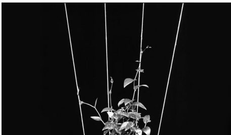
Abb. 1-3: Das Blumenwunder , 1926