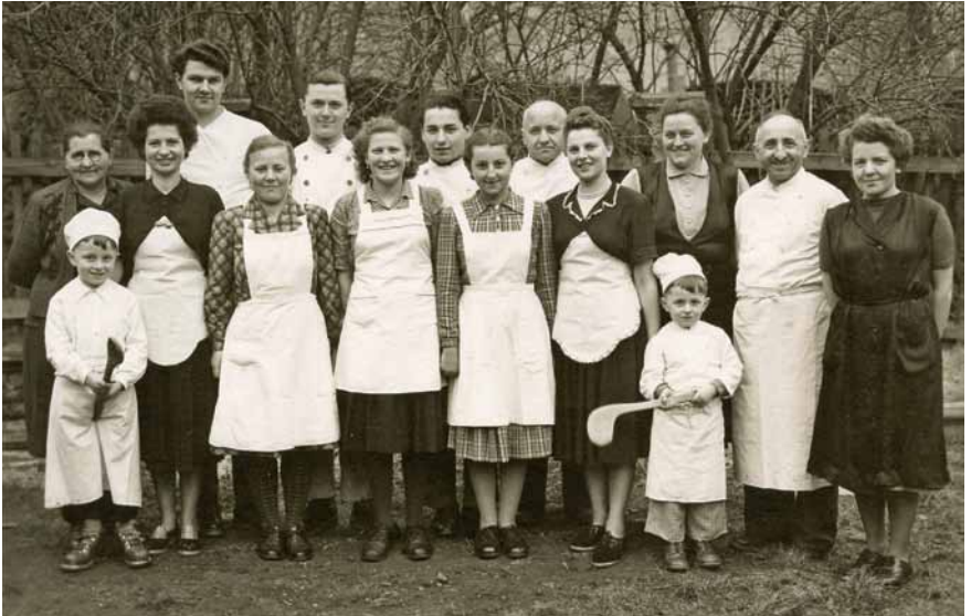
Belegschaft des Café Hipp 1957

Deshalb wurde ich auch dazu bestimmt, bei einer der ersten Marketingaktionen unseres Familienbetriebes Mitte der 1950er Jahre mitzuwirken. Mit dem beginnenden Wirtschaftswunder füllten sich damals auch in unserer beschaulichen Kleinstadt die Schaufenster der Geschäfte mehr und mehr mit Produkten, die nicht von örtlichen Handwerkern und Gewerbetreibenden produziert wurden, sondern aus industrieller Herstellung stammten. Unsere Konditorei bekam diesen Trend dadurch zu