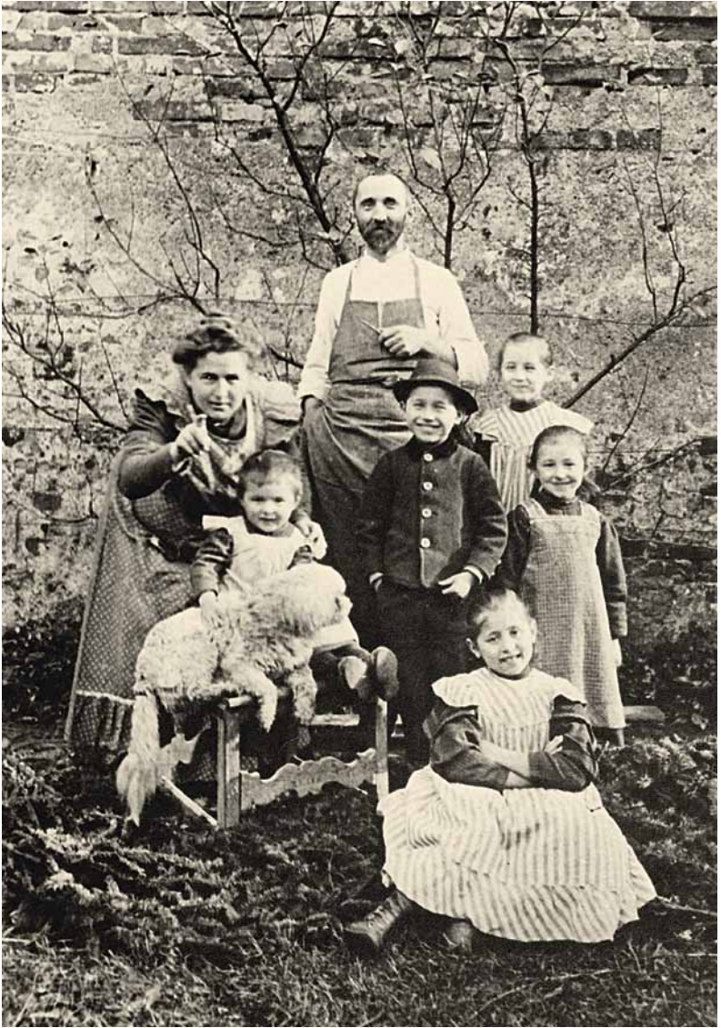
Die Gründerfamilie der Hipp-Baby-Kost, Familie Hipp um 1918