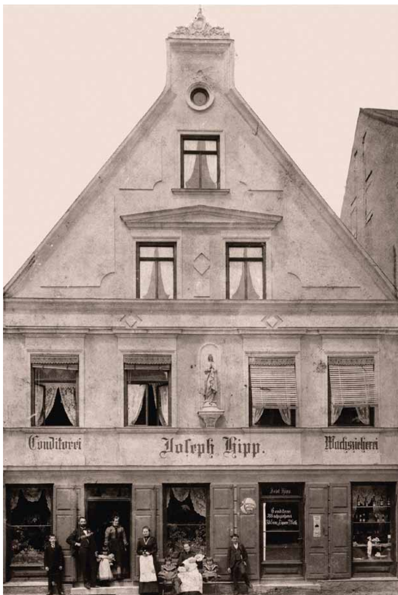
Lebzelterhaus um 1910