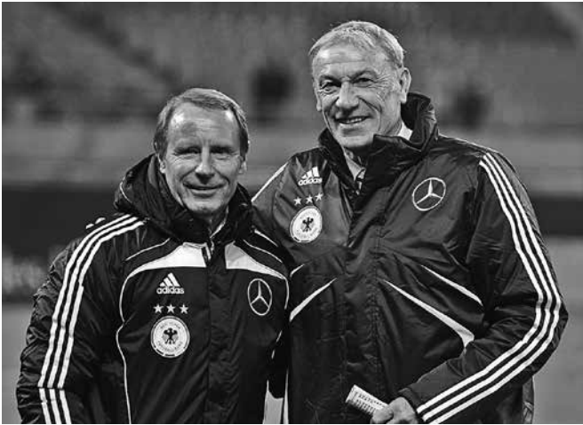
»20 Jahre Fußball-Einheit« – Bertie Vogts und Eduard Geyer beim Jubiläumsspiel Weltmeister von 1990 gegen DDR-Legenden.

gegeneinander anzutreten, wenn beide Mannschaften derselben Nation angehören. So wurde aus der ursprünglich vorgesehenen Fünfer- eine Vierergruppe und das Spiel gegen Belgien zum letzten Freundschaftsvergleich.