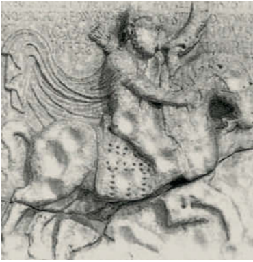
Der Ostgotenkönig Theoderich trat das Erbe des untergegangenen Römischen Reiches an