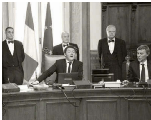
Der neu gewählte italienische Ministerpräsident Matteo Renzi (Mitte vorne) bei seinem ersten Meeting in Rom

2014 Der vormalige Bürgermeister von Florenz, Matteo Renzi, wird im Februar zum neuen Ministerpräsidenten gewählt.