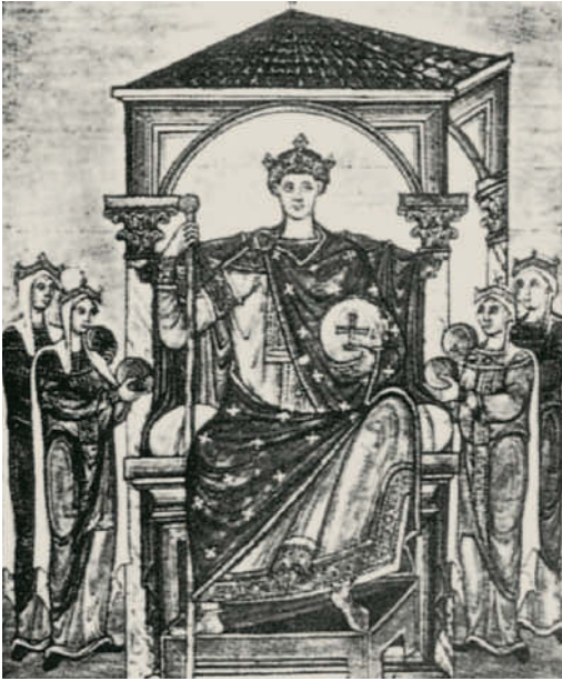
Oben: Kaiser Otto II. hält 976 Reichstag in Verona Unten: Seine Familie prägte die Region um den Gardasee: Cansignorio della Scala