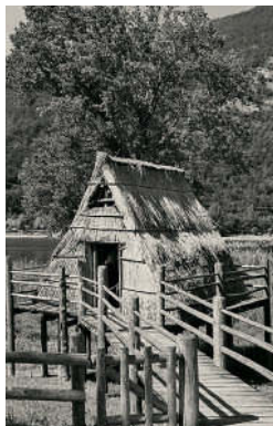
Rekonstruktion von Pfahlbauten am Ledrosee

888–924 Langobardenkönig Berengar I. versucht,