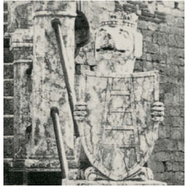
Wappen des Geschlechts der Scaliger mit der Leiter (Scala)

ganz Ober- und Mittelitalien zu beherrschen. Er wird von den Burgundern besiegt und in Verona ermordet.