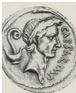
Römische Münze mit dem Bildnis Caesars

89 v. Chr. Verona wird römische Kolonie und erhält damit neue Rechte. 49 v. Chr. erlangen die Einwohner der Stadt das römische Bürgerrecht.