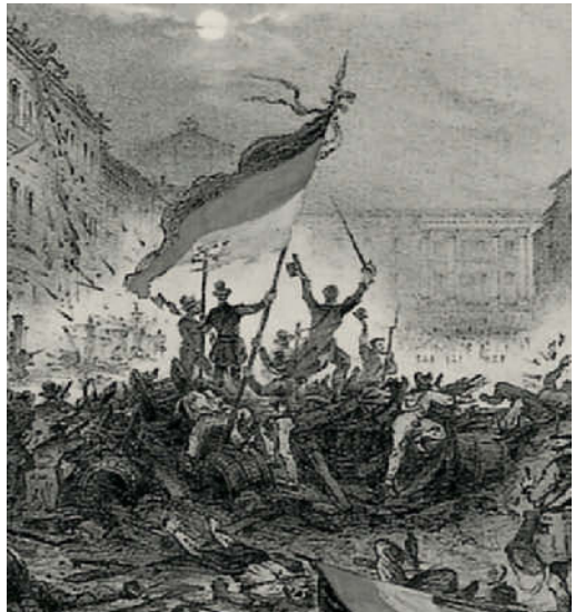
Barrikaden für Bürgerrechte: Märzrevolution von 1848