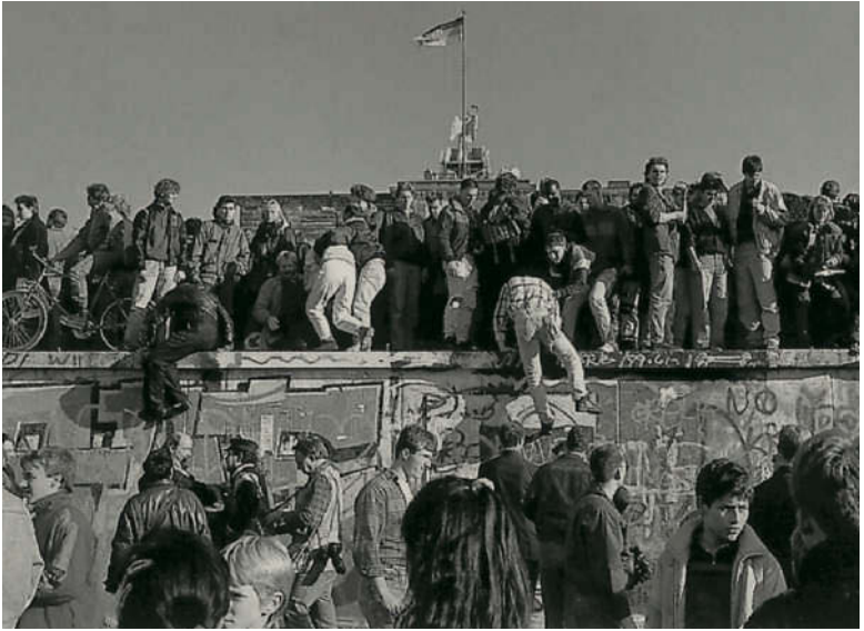
Die Welt hält den Atem an: Mauerfall, 9. November 1989

Josef Bachmann verübt ein Attentat auf den Studentenfürher Rudi Dutschke.