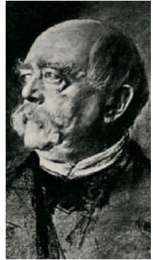
Könige Friedrich Wilhelm I. und Friedrich der Große, Reichskanzler Otto von Bismarck (v.l.n.r.)