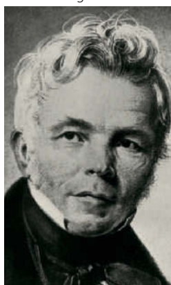
Seine Bauten prägten Berlin: Karl Friedrich Schinkel

1640–88 Der »Große Kurfürst« Friedrich Wilhelm gibt Impulse für den Aufstieg Brandenburg-Preußens.