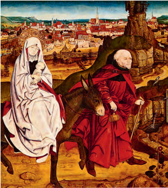
Schottenmeister, Flucht nach Ägypten mit Ansicht von Wien, nach 1469. Museum im Schottenstift, Wien

die Herrschaft in Österreich, die jedoch von der Wiener Bürgerschaft nach Beschneidung ihrer Rechte in mehreren erfolglosen Aufständen bekämpft wurden. Eine neue Blüte brachte das 14. Jh. 1365 stiftete Herzog Rudolf IV. die Universität. Als baukünstlerische Leistung dieser Zeit sind die Langchöre und Hallenkirchen mit ihrem neuen Raum-