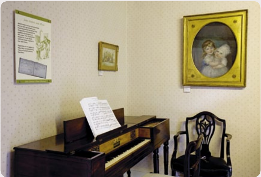
Jane Austens Pianoforte (um 1800) in Chawton Cottage