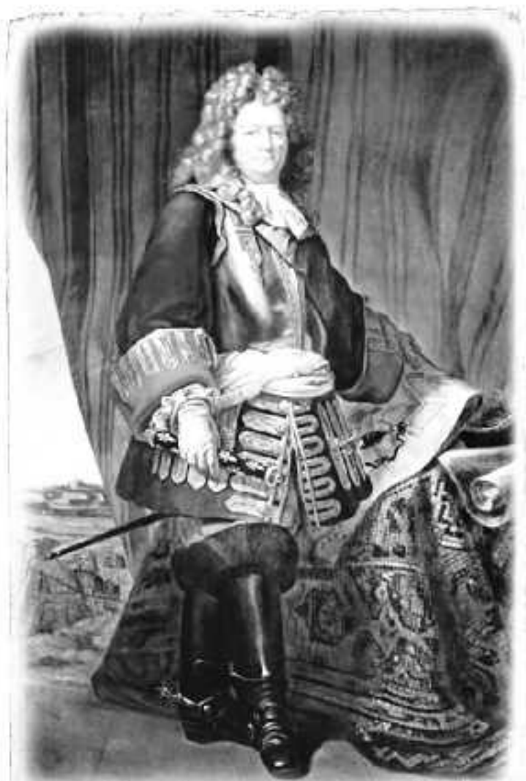
Sébastien le Prestre Marquis de Vauban.