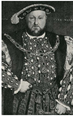
Henry VIII. (1491–1547).

1598 Die erste umfassende Stadtbeschreibung, »Survey of London« von John Stow, erscheint.