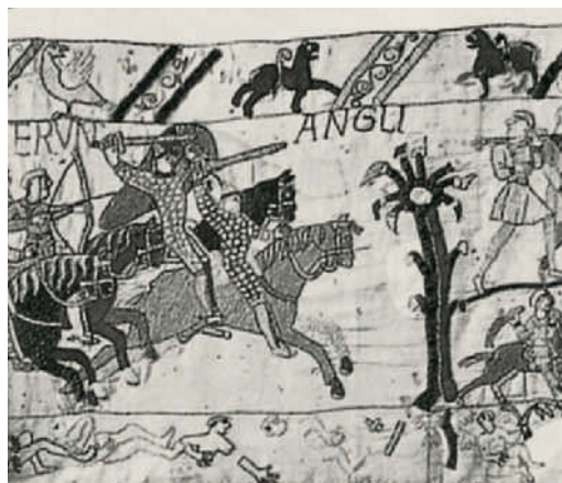
Der Teppich von Bayeux schildert die normannische Eroberung Englands

1455 Beginn der Rosenkriege zwischen dem House of Lancaster und dem House of York. Symbol dieser Thronstreitigkeiten wer-