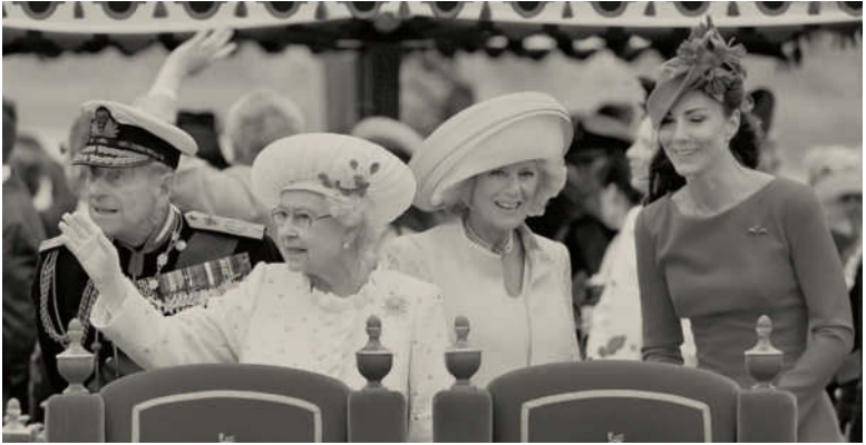
Mit einer Bootsparade auf der Themse feiert Queen Elizabeth 2012 ihr 60. Thronjubiläum

um 1940 Rund 9 Mio. Menschen leben in London und Greater London.