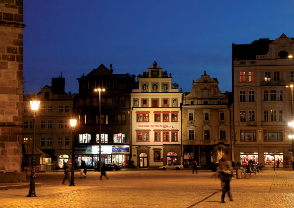
Abendstimmung am Platz der Republik.

Wenn wir uns vor das Eingangsportal der Kathedrale stellen und den Blick auf die Pestsäule richten, sticht rechts von ihr ein bemaltes Haus ins Auge – das Rathaus. Es wurde 1554–1559 nach Plänen des italienischen Architekten Giovanni de Stata im Stil der Renaissance erbaut. Das sich links anschließende weiße Haus mit seinen mächtigen Außenfeilern, das heute die Touristeninformation beherbergt, war zwei Jahre lang Residenz des deutschen Kaisers. Um der in Prag wütenden Pest zu entgehen, machte Rudolf II. Pilsen 1599 vorübergehend zu seinem Regierungssitz.