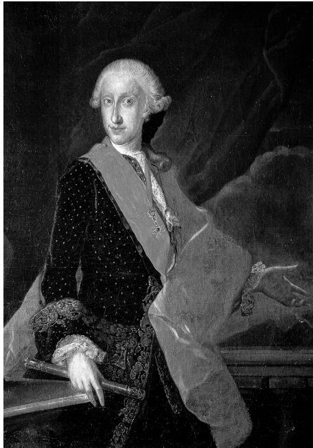
Ferdinando IV. (1751–1825) um 1770, etwa zwei Jahre nach seiner Hochzeit mit Maria Carolina.