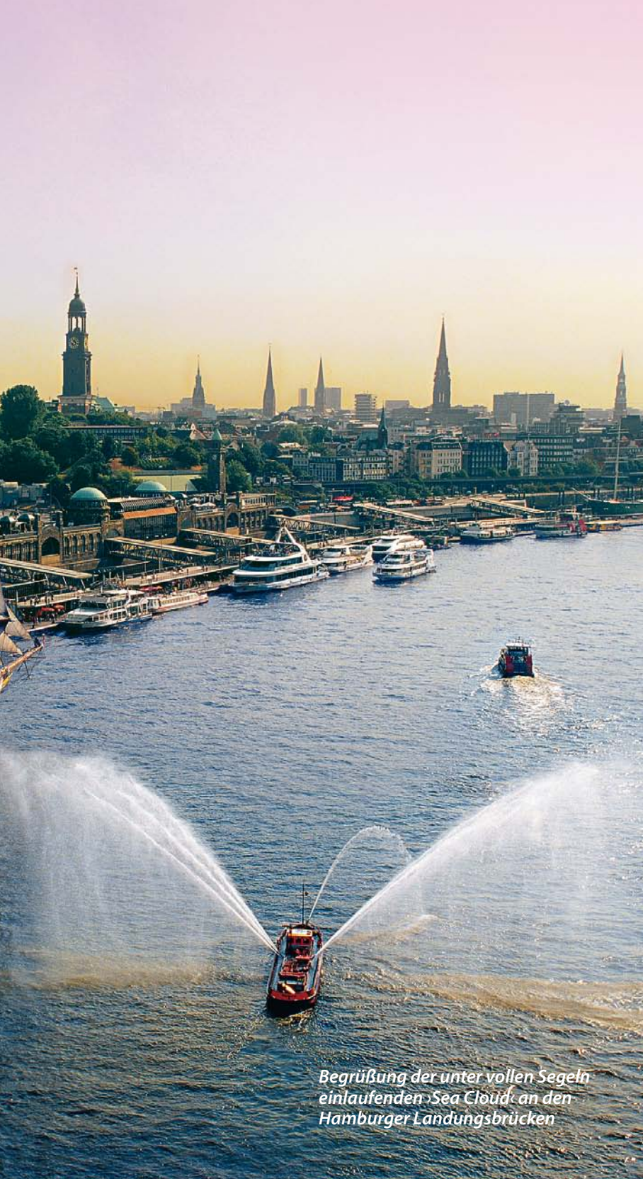
Begrüßung der unter vollen Segeln einlaufenden Sea Cloud an den Hamburger Landungsbrücken