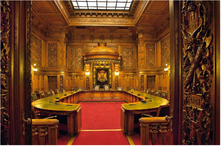
Hier geht es um Hamburg: Im Senatssaal des Rathauses wird Stadtstaat-Politik gemacht

Die 647 Räume des Rathauses sind wie die Repräsentationssäle und Treppenhäuser hanseatisch-gediegen eingerichtet. Im Holzgetäfelten Plenarsaal tagt die Hamburger Bürgerschaft , das Landesparlament der Hansestadt. Seinen Zuschauerrang fassen Säulen mit geschnitzten korinthischen Kapitellen ein. Auch die Mitglieder des Hamburger Senats , der Landesregierung, gehen im Rathaus ihrer Arbeit nach. Das Zimmer des Ersten Bürgermeisters befindet sich in der Nordecke des Gebäudes.