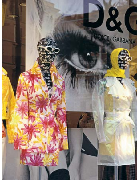
Oben: Blumen & Brillen – Dolce & Gabbana Links: Papst Benedikt XVI. bei der Weihnachtsmesse am Petersplatz. – Ein Füllhorn voller Obst und Gemüse auf dem Campo de' Fiori. – Anmutiger antiker Garten: der Hippodromus des Domitian auf dem Palatin Unten: Meeresrauschen mitten in Rom – die Fontana di Trevi, eine Art Disney-Kulisse des 18. Jh., begeistert mit theatralischen Effekten

Wenn es dann Abend wird in der Tiberstadt, wenden Römer und Reisende sich gern nach Süden, um im stimmungsvollen Viertel Trastevere , in seinen von Bars und Trattorien gesäumten Gassen, den Tag bei Aperitif, Wein und römischen Spezialitäten zu beschließen.