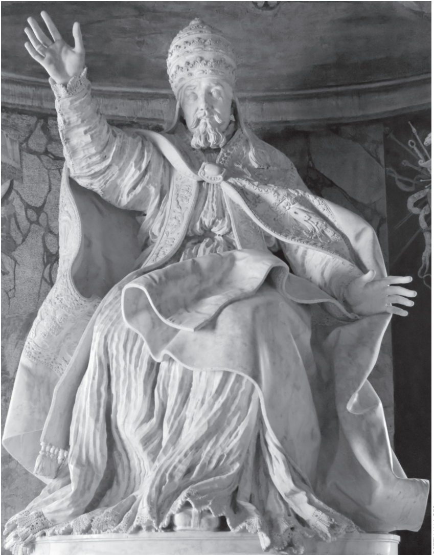
Denkmal Urbans VIII. (Marmorskulptur von Gian Lorenzo Bernini, um 1640)