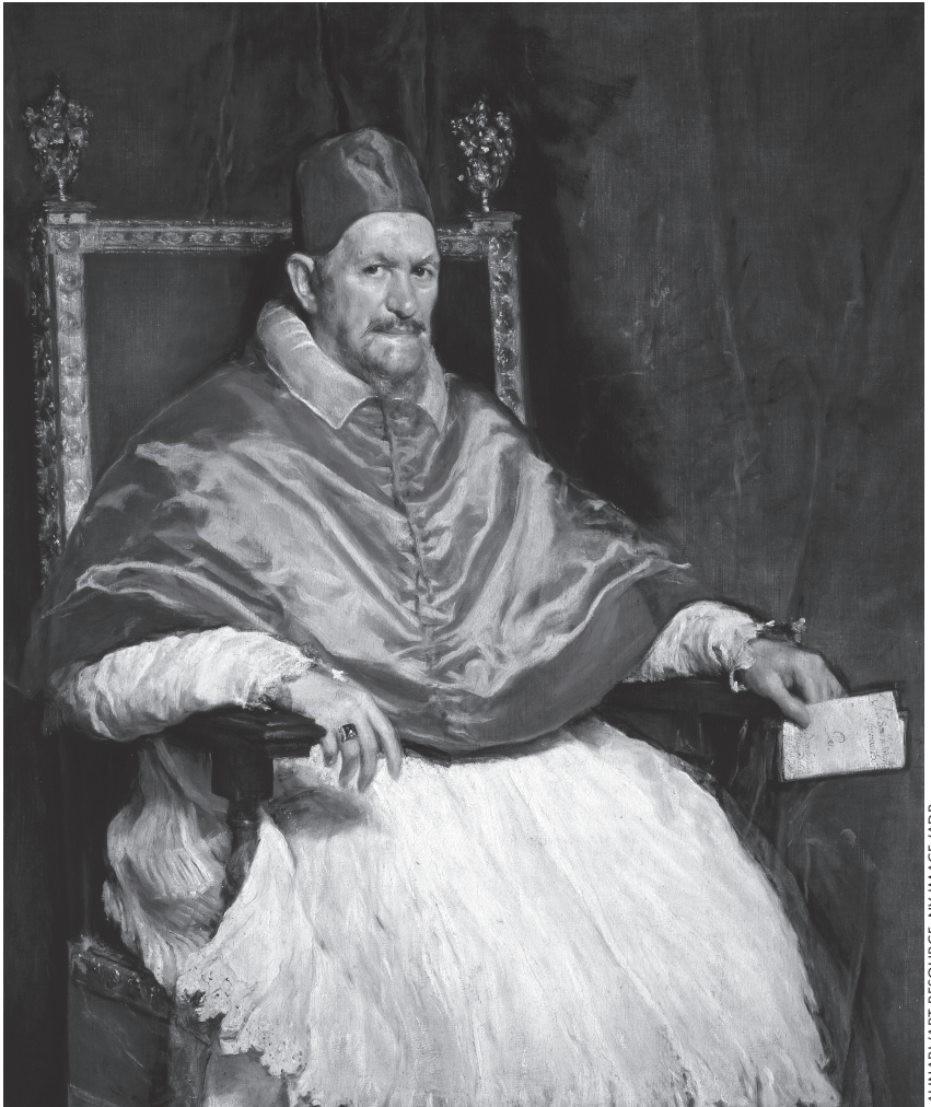
Papst Innozenz X. (Gemälde von Diego Velázquez, 1650)