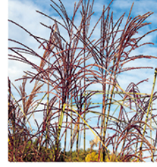
4. Chinaschilf 'Kleine Fontäne'