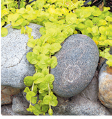
1. Pfennigkraut 'Goldilocks'