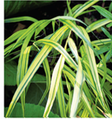
13. Japangras 'Aureola'