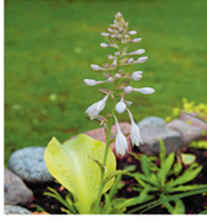
2. Funkie 'Golden Waffles'