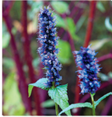
11. Duftnessel 'Black Adder'