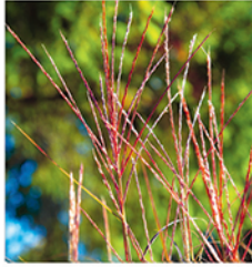
7. Chinaschilf 'Kleine Silberspinne'