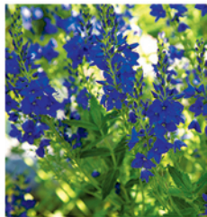
16. Großer Ehrenpreis 'Knallblau'