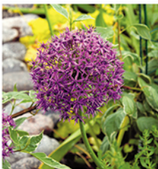
22. Purpur-Kugellauch 'Purple Sensation'