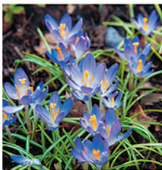
21. Dalmatiner-Krokus 'Barr's Purple'