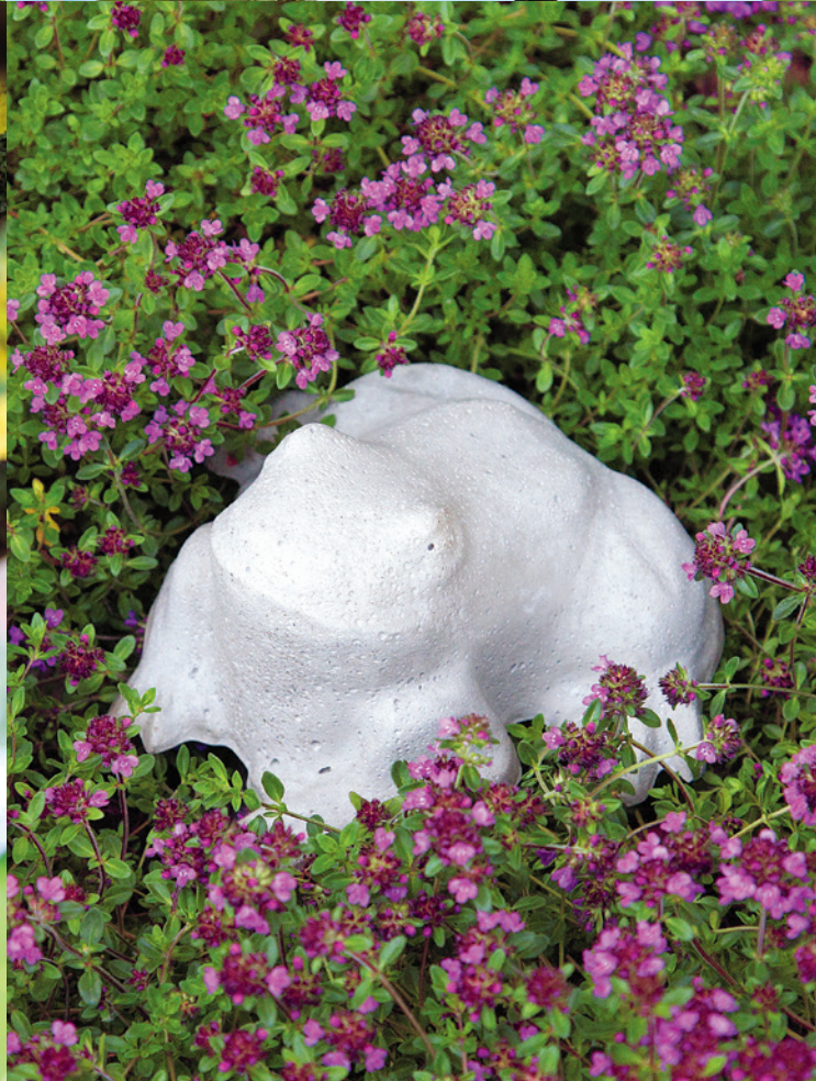
Bilder von rechts nach links: kühler Ruheplatz S. 19, Zitrusstütze S. 231, Korb für Meisenknödel S. 179, Frosch S. 45