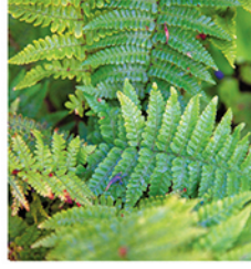
3. Schuppiger Wurm- farfarn 'Crispa'