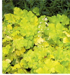
8. Purpurglöckchen 'Lime Rickey'