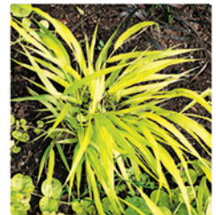
20. Japangras 'All Gold'