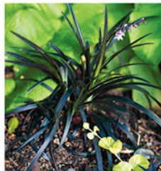
18. Schwarzer Schlan- genbart 'Nigrescens'