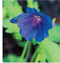
14. Pracht- Storchschnabel