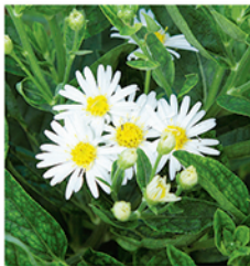
17. Ageratum-Aster 'Starshine'