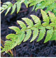
6. Gelappter Schildfarn