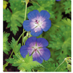
10. Storchschnabel 'Rozanne'