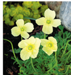
19. Islandmohn 'Pacino'