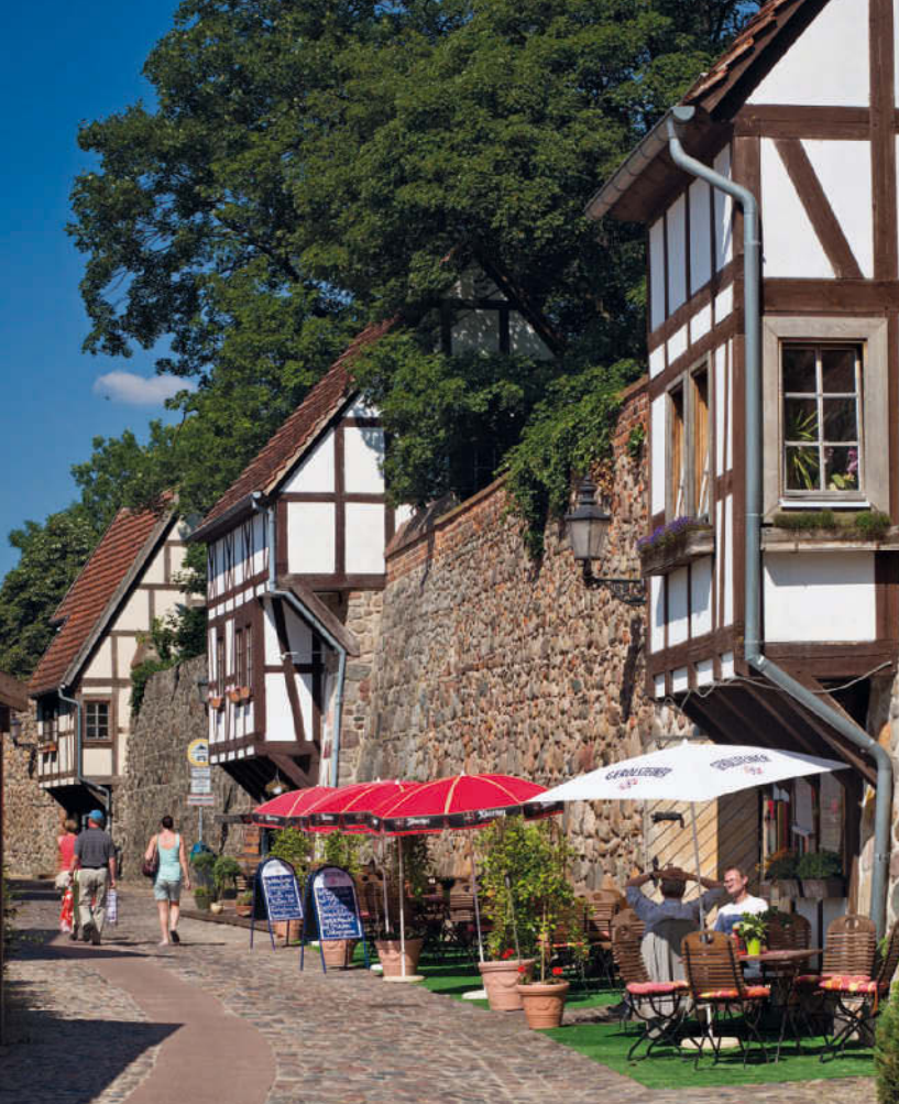
Sonniges warmes Plätzchen – im Schutz der Neubrandenburger Stadtmauer