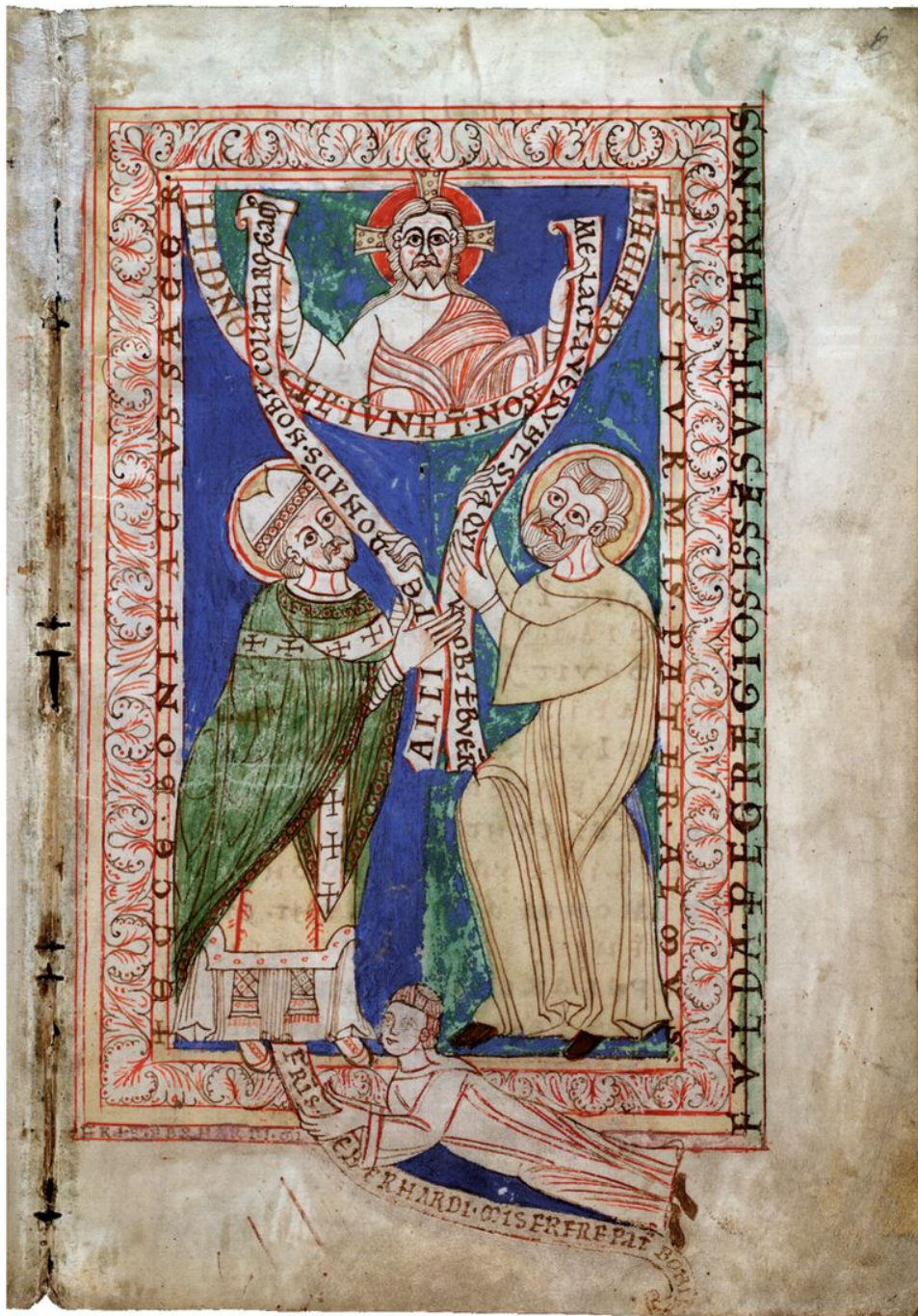
Abb. 2: Codex Eberhardi, Widmungsbild (StAMR, K 426, Codex Eberhardi, Bd. 2, f. 6r).