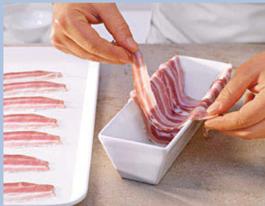
(1) Gleich große, dünne Speckscheiben leicht überlappend in die Form legen, so dass die Enden über den Rand reichen.