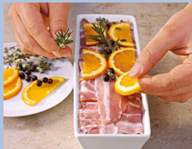
(4) Die Terrine oben mit einer passend zugeschnittenen Scheibe Speck vollständig verschließen, garnieren und garen.