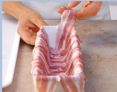
(2) Auch die Ecken der Form vollständig auskleiden. Dazu den Speck extra breit schneiden oder zwei Scheiben einlegen.