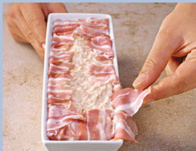
(3) Die Farce einfüllen, die überhängenden Speckteile zur Mitte klappen und von den Seitenwänden her gut andrücken.