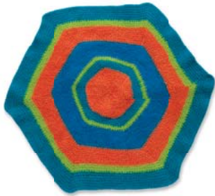
Gefilterter Spielteppich 54