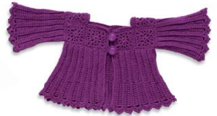
Rippen- jäckchen 102