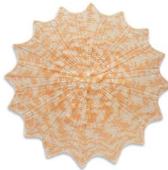
Sonnenschein- decke 44