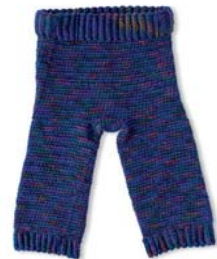
Wichtels Windelhose 88