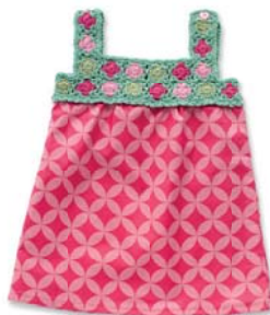
Erdbeerzeit – Erdbeerkleid 82