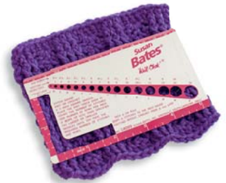
Häkelanleitungen verstehen 22