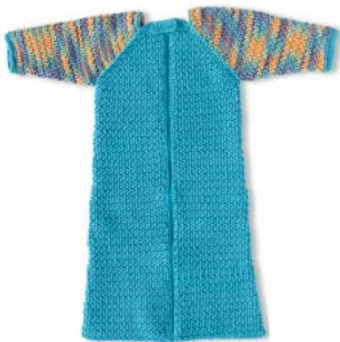
Schlafsack für süße Träume 38