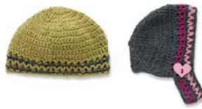
Beanie und Mütze 120