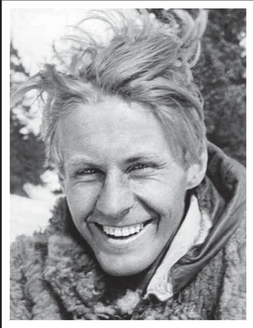
Porträt von Thor Heyerdahl als jungem Mann