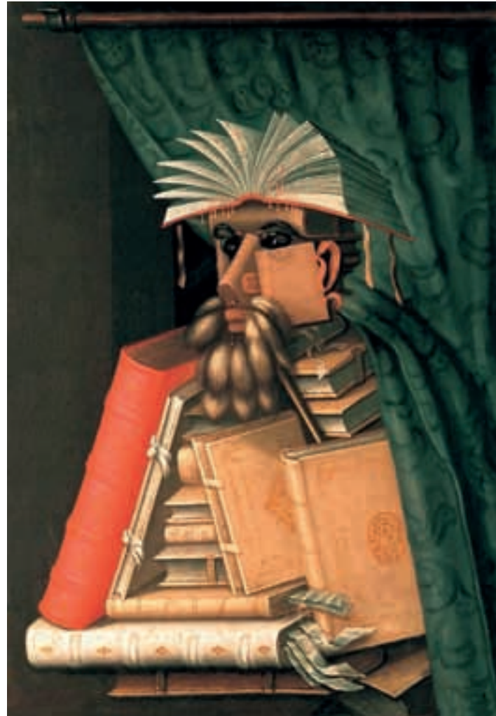
DER BIBLIOTHEKAR, GIUSEPPE ARCIMBOLDO, 1562

In seinen Zwanzigern bereiste er immer wieder verschiedene Gegenden Europas und lernte dabei auch die Alhambra kennen, einen ehemaligen maurischen Palast im spanischen Granada. Er war fasziniert von der Gestaltung großer Flächen durch die maurischen Kunsthandwerker. Das religiöse Verbot der Darstellung lebender Wesen hatte diese hauptsächlich auf nicht gegenständliche Motive beschränkt, die als geschickt aufgebaute rhythmische Muster in unterschiedlichen Farben die Flächen harmonisch strukturierten. Escher stellte sich, darauf aufbauend, vor, wie dynamisch Muster von gleichförmigen Darstellungen belebter Dinge wirken würden, etwa von Vögeln, Fischen