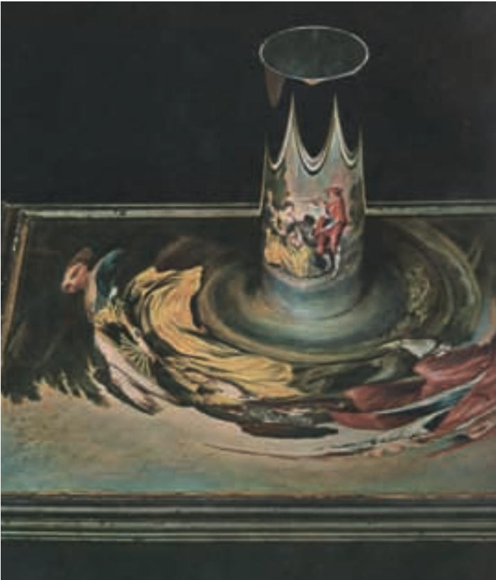
ANAMORPHOSE EINES UNBEKANNTEN KÜNSTLERS VON NICOLAS LANCRETS (1690 – 1743) GEMÄLDE PAR UN TENDRE CHANSONNETTE (MITHILFE EINES ZÄRTLICHEN LIEDCHENS)

um gesellschaftlich und politisch heikle Themen verschlüsselt darstellen zu können. Bis heute üben Bilder wie das auf dieser Seite gezeigte Beispiel eine große Faszination aus.