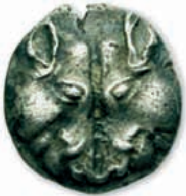
MÜNZE VON DER INSEL LESBOS, CA. 500 V. CHR.

Optische Illusionen werden ganz allgemein geschätzt und entfalten ihren Reiz auf unterschiedlichen Ebenen. Vom simplen Vergnügen am gelungenen Bildwitz bis zur Darstellung mathematischer Sachverhalte in der bildenden Kunst können sie Betrachter in fast allen Altersstufen entzücken. Sie werden in der Psychologie ebenso genutzt wie in der Neurowissenschaft, um herauszufinden, wie der menschliche Geist auf unterschiedliche optische Reize reagiert. Selbst die Philosophie nutzt die Fehler der menschlichen Wahrnehmung bei der Untersuchung des Konzepts der Realität. Sogar die Natur selbst präsentiert uns optische Täuschungen, etwa wenn die Sonne scheinbar drei- oder viermal so groß wird wie sonst, sobald sie sich dem Horizont nähert. Tatsächlich verändert sie dabei ihre Größe nicht.