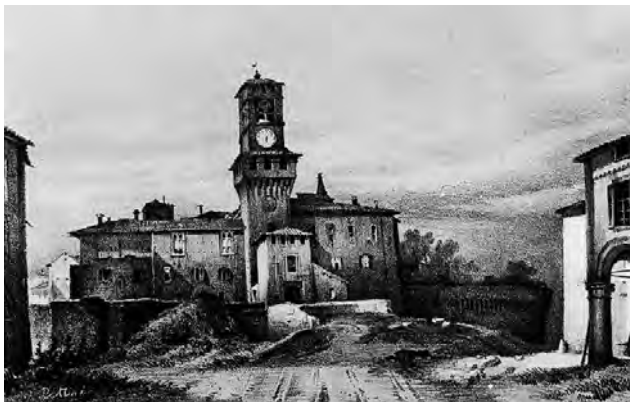
Die Rocca Pallavicina in Busseto

Bei einer von Adligen und Mailänder Bürgern getragenen Konzertgesellschaft, wiederum einem Liebhaberensemble, sprang Verdi eines Tages als Korrepetitor bei einer Probe zu