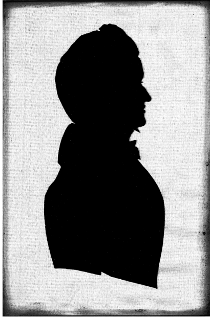
Scherenschnitt eines unbekanntes Künstlers vom Spätherbst 1835. Das erste bekannte Bildnis Richard Wagners war ein Geschenk an seine spätere Gattin Minna Planer, um die er damals – während er Das Liebesverbot komponierte – warb.