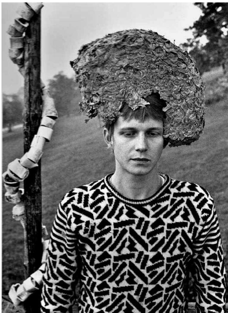
mit Wespennest und -pulli in Spiegelberg, 1985