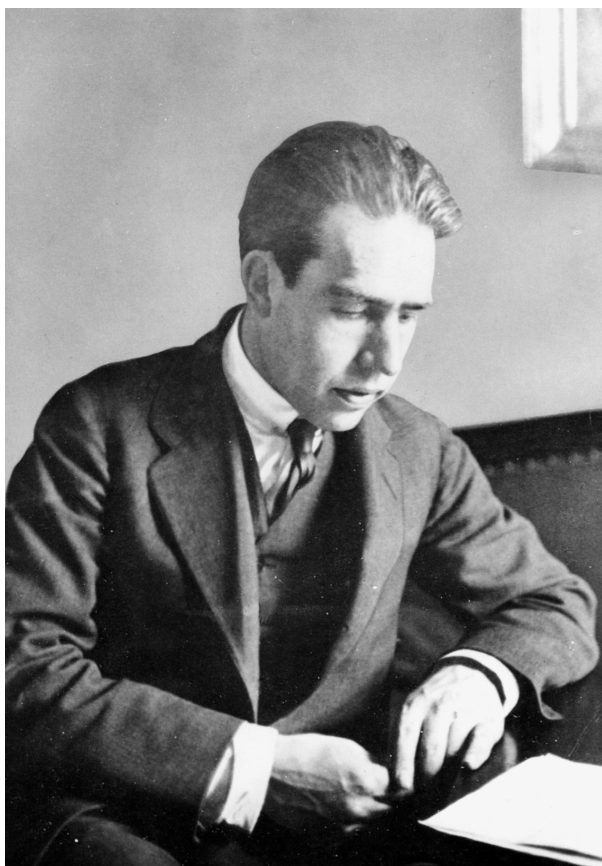
Niels Bohr in frühen Jahren