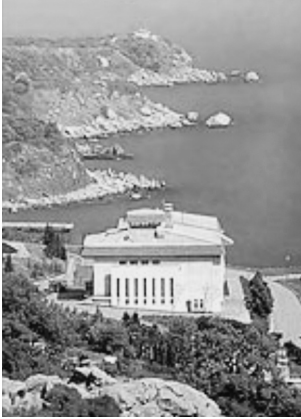
Das staatliche Sommerhaus am Kap Foros auf der Krim. Hier wurde Gorbatschow im August 1991 samt seiner Familie von den Putschisten isoliert.

einer Supermacht im Grunde genommen zusteht, auch wirklich haben, dann muss er sich auch als Präsident benehmen, d. h. mit einem Akzent auf wachsender Autorität. Erst dann wird unser Volk sein Recht, in einem Palast zu leben, akzeptieren und das Maul halten. Wenn er sich aber als Demokrat darstellen will – ich bin sozusagen so, wie ihr alle –, dann führt dies alles zu seiner eigenen Diskreditierung und zu Respektverlust.