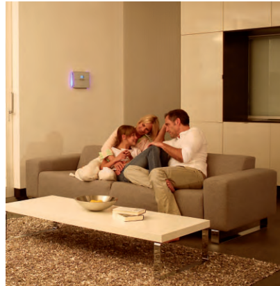
Produkte von ABUS geben jedem Hausbewohner ein besonderes Gefühl von Sicherheit.