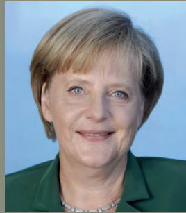
Dr. Angela Merkel, Bundeskanzlerin der Bundesrepublik Deutschland

So haben wir in Deutschland auch gute Erfahrungen mit der Sozialpartnerschaft von Arbeitgebern und Arbeitnehmern als wichtigem Element der sozialen Marktwirtschaft gemacht. Während der Krise war die Zusammenarbeit der Sozialpartner beispielhaft. Trotz Umsatzeinbrüchen haben viele Unternehmen ihre Stamm-