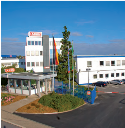
Der Standort Wetter ist immer noch das Herz des Unternehmens.