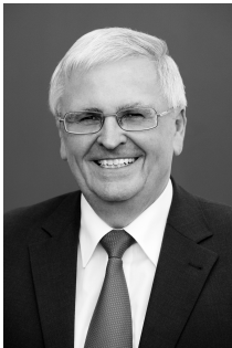
DFB-Präsident Dr. Theo Zwanziger

Die Teilnahme am Fußballsport ist für viele Menschen weit- aus mehr als bloße Freizeitbeschäftigung. Mit über 500.000 ehrenamtlichen Trainern, Schiedsrichtern und Betreuern ist unser Sport auch eines der wichtigsten sozialen Netzwerke in Deutschland. Dies bietet uns über die Entwicklung des mo- dernen Fußballs hinaus die Chance, uns einzusetzen für ein respektvolles Miteinander der Kulturen, für Fairness, für den Abbau von Vorbehalten zugunsten von Verständigung und To- leranz im Umgang miteinander in der ungezwungenen Atmo- sphäre von Sport und Spiel.