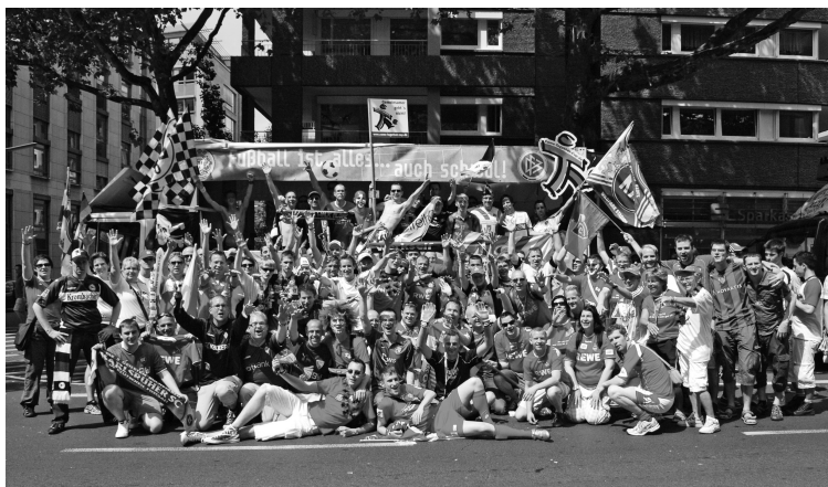
Die Queer Fußball Fanklubs beim CSD in Köln.

bisch-schwulen Bürgerrechtsbewegung der USA, die sich 1969 nach Unruhen in der Bar Stonewall in der Christopher Street in New York gründete. Zum ersten Mal setzen sich Lesben und Schwule zur Wehr. Nach und nach entstand in den 1970er- und 1980er-Jahren vor allem in den Großstädten eine gut funktionierende Infrastruktur aus Bars, Clubs und Magazinen.