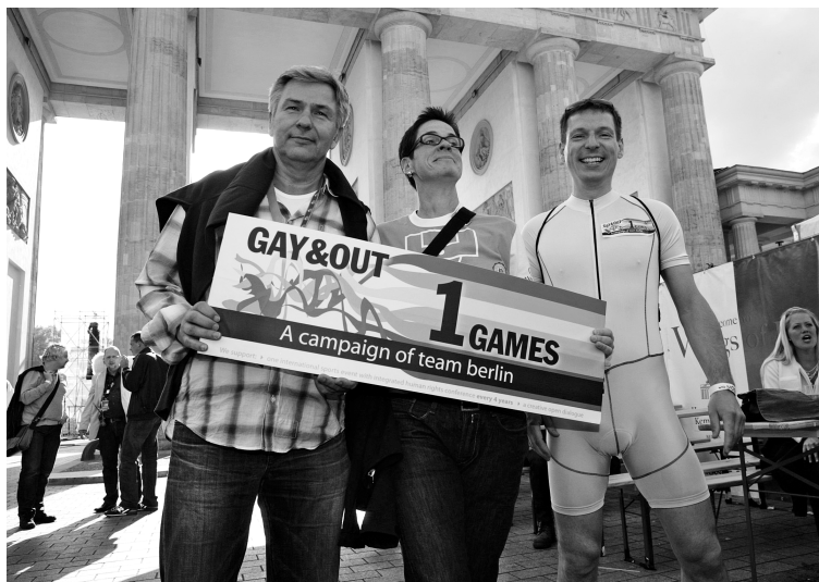
Der Berliner Bürgermeister Klaus Wowereit beim Christopher Street Day in Berlin.

In der Stadt gibt es noch Leute, die sich trauen, dieses Verhalten an den Tag zu legen. Da ist der Sportplatz nur ein Spiegel. Inzwischen hat der offizielle deutsche Fußball aber das Problem erkannt und begonnen, aktiv zu werden. Das ist sehr zu begrüßen. Auch dort wird Gesicht gezeigt, und das ist schon mal ein großer Schritt voran.