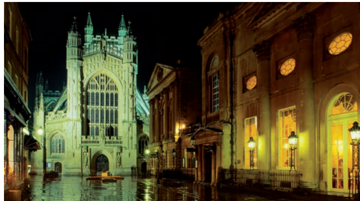
Die spätgotische (ab 1499) Abteikirche von Bath

wohl berühmteste prähistorische Monument Europas: mächtige Steinkreise aus der Zeit von 2800 bis 1100 v. Chr.