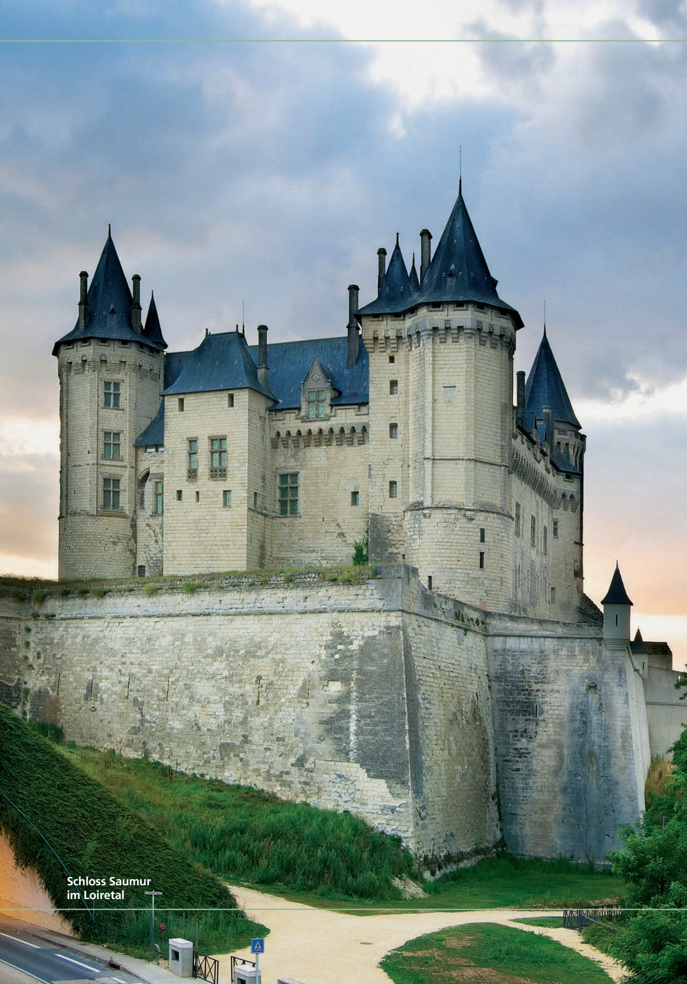
Schloss Saumur im Loiretal