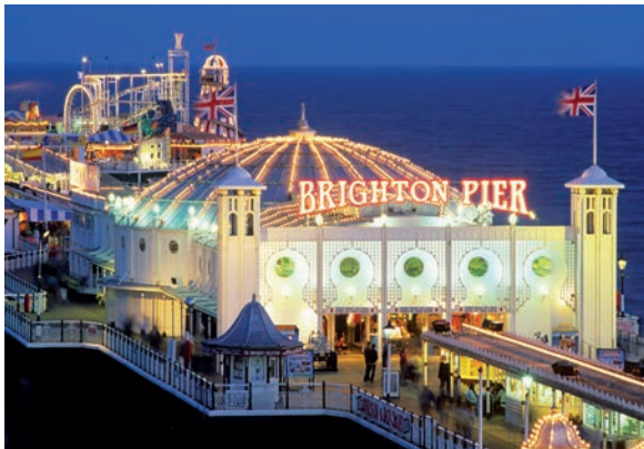
Brighton Palace Pier